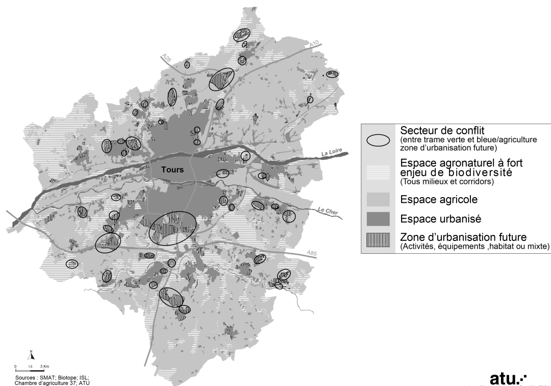
Figure 2 : Identification des secteurs de conflits entre la trame verte et bleue, l'agriculture et les zones d'urbanisation future (aire du SCOT de l'agglomération tourangelle), Agence d'urbanisme de l'agglomération tourangelle 2013

Les travaux, identifiant des espaces précieux pour les continuités écologiques ou agricoles, ont été croisés avec les zones d'urbanisation future dans les documents d'urbanisme en cours. Cette analyse a révélé des incompatibilités avec les ambitions de protection du " socle agronaturel " (cf. figure 2). Pendant le processus du SCOT, des réunions au sein des communautés de communes avec cartographie à l'appui ont permis aux élus de visualiser ces enjeux sur leurs territoires respectifs. Les discussions ont abouti à un déclassement de 400 ha sur les 1200 ha de zones à urbaniser inscrits dans les documents d'urbanisme en cours.