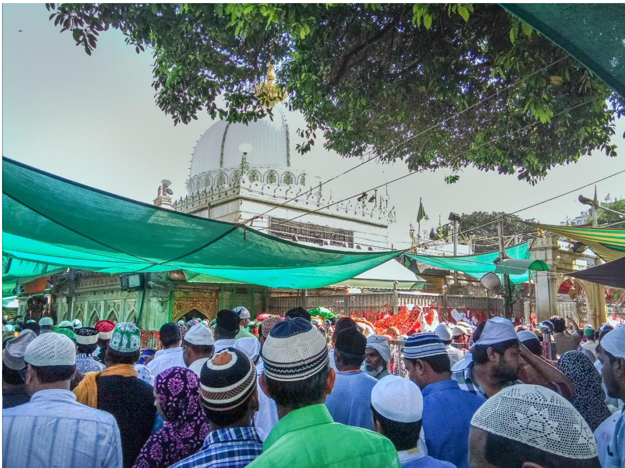
figure 1 : des croyants musulmans prient face au mausolée du saint soufi Muinuddin Chishti, dans la ville d’Ajmer au Rajasthan. La plupart des saints soufis et leurs descendants revendiquent une ascendance prophétique. Ils font ainsi partie d’une catégorie sociale désignée par le terme de « sayyid », généralement placée en haut de la hiérarchie sociale symbolique.

Mots clés : politique de représentation minoritaire, associations, islam, caste, Inde