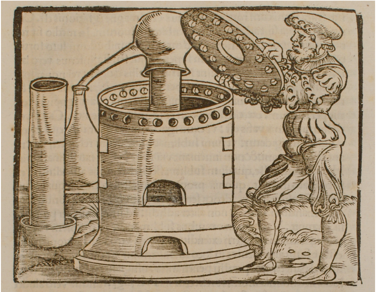
Pseudo-Geber, De alchimia [i.e. Summa perfectionis] , Strasbourg : J. Grüninger, 1529, fol. 25r°

Ces recommandations portent la marque de l'expérience. Le pseudo-Geber est passé par les erreurs qu'il décrit, les a analysées et en a tiré les enseignements techniques. L'alchimiste se montre ici clairement homme de laboratoire, habile et expérimenté.