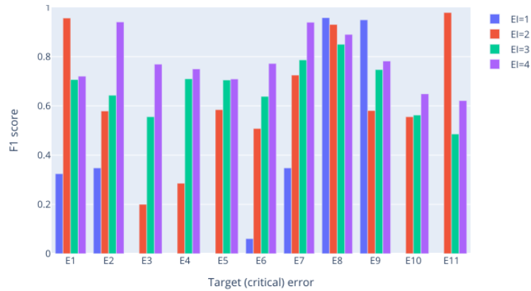
FIG. 3: Évolution du F1-score en fonction de la taille du paramètre EI