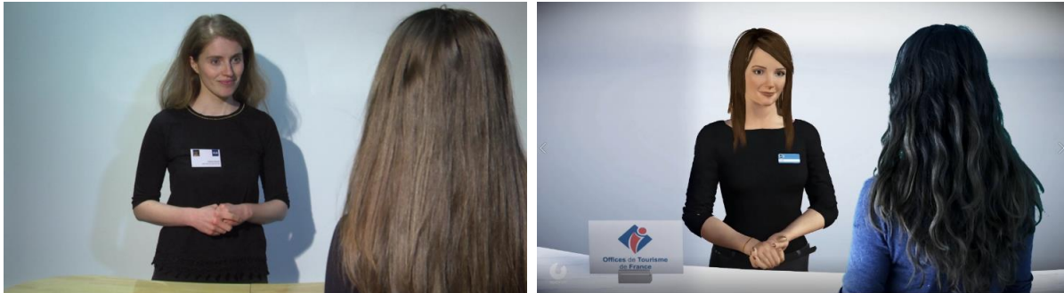
Figure 2. Illustration d'une vidéo d'interaction entre la touriste humaine et la conseillère touristique humaine (gauche) ou virtuelle (droite).

le phénomène de comparaison de ces conditions. Ainsi, chaque participant était confronté à une conseillère humaine ou virtuelle, exprimant des comportements intimes ou non intimes. Enfin, La variable Longueur a été manipulée en intra-sujet de sorte que chaque participant était confronté à trois interactions différentes dont la longueur des scénarios variait. Au total, notre corpus se composait de 12 vidéos d'interaction, correspondant aux 12 conditions expérimentales (voir Figure 2 ).