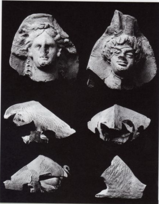
3. Selezione del set di antefisse e acroteri relative alla decorazione della cd. villa del Moltone di Tolve-Pz (da Russo, TAGLIENTE 1992)

culto attestati in Lucania (CAZANOVE 1997). Riprendendo le sue parole, si trattava di definire “l’étendue et les limites exactes” della pertinenza della plastica architettonica come uno dei principali markers dei luoghi di culto. Il suo catalogo riporta 95 luoghi di culto per tutta la Lucania (e quindi non soltanto la Basilicata) nel periodo compreso fra l’epoca arcaica e quella imperiale, includendo i complessi santuariali delle colonie greche. Eccezion fatta per i 48 luoghi di culto delle quattro apoikiai (Poseidonia, Velia, Metaponto e Siris/Eraclea), soltanto 3 dei 47 rimanenti sono i siti della Basilicata preromana (fra questi Armento e Rossano di Vaglio) caratterizzati dalla presenza di terrecotte architettoniche. Queste ultime, dunque, rappresenterebbero secondo lo studioso francese un indicatore culturale “ sous-représenté ” in Lucania, a differenza di quanto riscontrabile in ambito etrusco, Lazio e Campania.