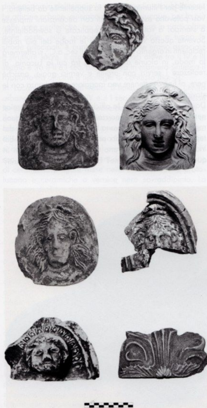
5. Selezione dei principali tipi di antefisse attestati nel santuario di Rossano di Vaglio fra IV e I sec. a.C. (da ROMANO 2012)

attestati in Basilicata (45) e il 2% di tutti i siti (necropoli a parte) documentati fino ad oggi in Lucania. È dunque evidente che siamo di fronte a un uso assolutamente non sistematico delle terrecotte architettoniche nel decoro dei luoghi di culto della Basilicata. L'equazione 'tca = luoghi di culto' non funziona, e ciò non soltanto in Basilicata ma anche, e in modo ancora più visibile, nel resto della Lucania. Colpisce, certo, il set molto importante più dal punto di vista quantitativo che qualitativo del santuario di Rossano di Vaglio (fig. 5) e ci si chiede dunque come mai gli altri santuari lucani di questo periodo non siano stati decorati in modo altrettanto ricco. Se pensiamo a quelli di San Chirico Nuovo completamente sprovvisto (da ultimo ROMANIELLO 2012) o ancora di Satriano di Lucania (che presenta solo qualche frammento del resto completamente estraneo alla tradizione iconografica del