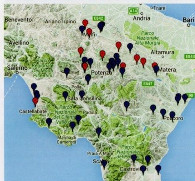
2. Carta di distribuzione dei luoghi di culto in Lucania fra VI e III sec. a.C. (a); carta di distribuzione dei siti che hanno restituito terrecotte architettoniche in Lucania fra VI e III sec. a.C. (b) (database Lucanie Antique )