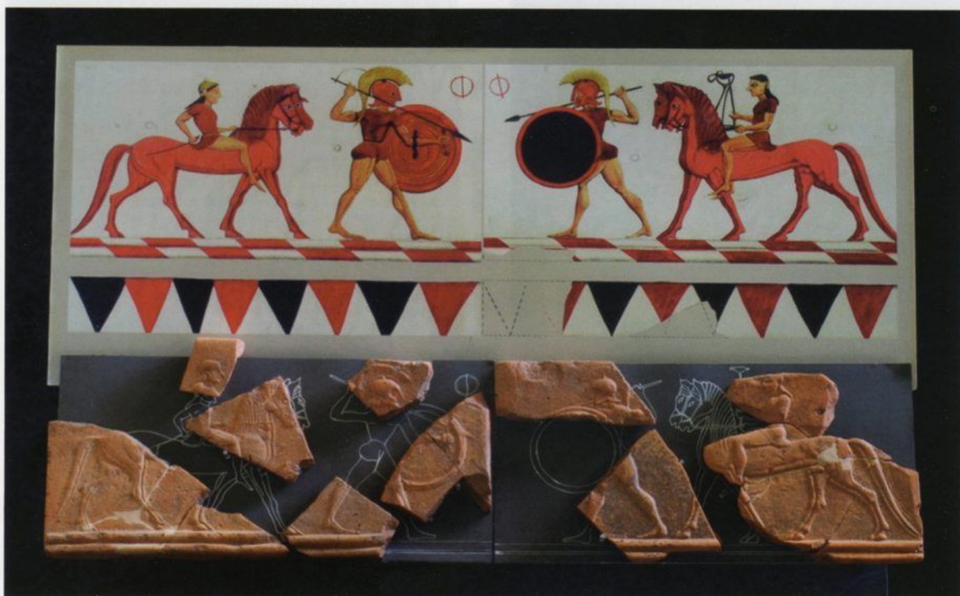
1. Le cd. 'lastre dei cavalieri' della struttura palaziale di Braida di Vaglio (PZ) al Museo Provinciale di Potenza

nell'interpretazione delle vestigia appena scoperte a Vaglio di Basilicata, tanto sul pianoro di Serra San Bernardo che nella località di Braida, posta sulle sue pendici NE. Così se Ranaldi arrivava a identificare sul pianoro di Serra San Bernardo, a seguito della scoperta di alcuni frammenti di sima traforata, l'esistenza di un tempio in antis (RANALDI 1960, p. 19), D. Adamesteanu non esitava ad affermare che "[...] Vaglio, una città messa a tanta distanza dalla costa, ha uno tra i più grandi santuari di tipo perfettamente greco, elegante nella sua decorazione, ricco di moduli e di sfumature di colore e di plasticità" (ADAMESTEANU 1964, p. 137). A Braida il rinvenimento delle lastre del c.d. "fregio dei cavalieri" (fig. 1), nonché di una testa fittile interpretata come appartenente della statua di culto non