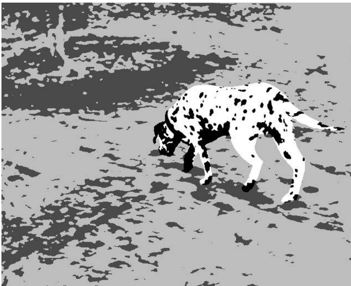
Figure 5. Notre perception est changée par notre connaissance. Une fois compris comment peuvent être interprétées ces taches, impossible de ne plus le voir ! Pour s'en convaincre, rendez-vous page précédente.