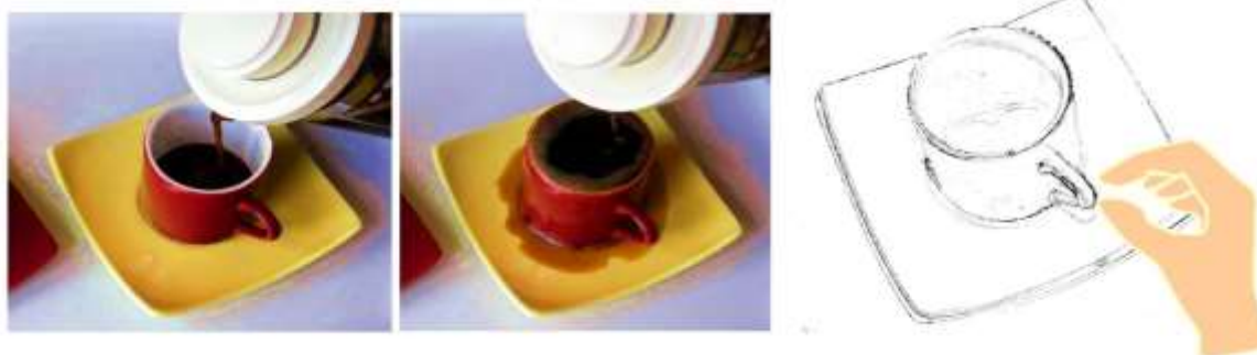
Figure 2. Voir et prévoir... pour ajuster ses gestes de tous les jours.