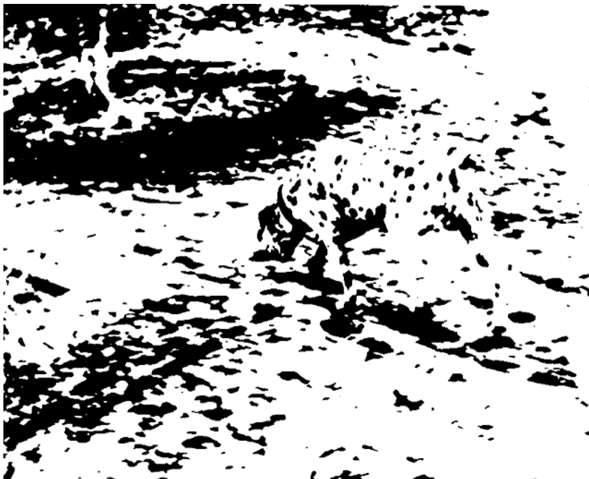
Figure 1. Voir et concevoir. Notre perception ne repose pas seulement sur l'agencement des taches lumineuses projetées sur notre rétine, mais aussi sur notre capacité à les interpréter. Voyez-vous ce qui est représenté ici ? Si ce n'est pas le cas, rendez-vous Figure 5.