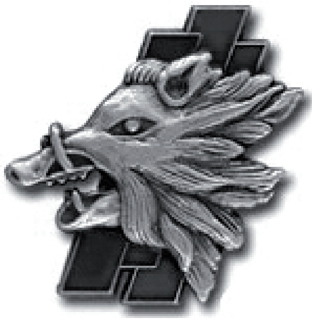
Figure 1. — Insigne de l'escadron de chasse 3/3 Ardennes suite à l'adjonction d'une troisième escadrille et homologué en 1995 par le S.H.A.A. sous le n° A1280

Bien souvent, les escadrons possèdent également des devises en accord avec leur insigne. C'est ainsi que les chasseurs du 3/3 Ardennes, qui se baptisent « les sangliers », ont adopté la devise « ne recule ni ne dévie » propre à l'animal, et censée caractériser leur état d'esprit guerrier.