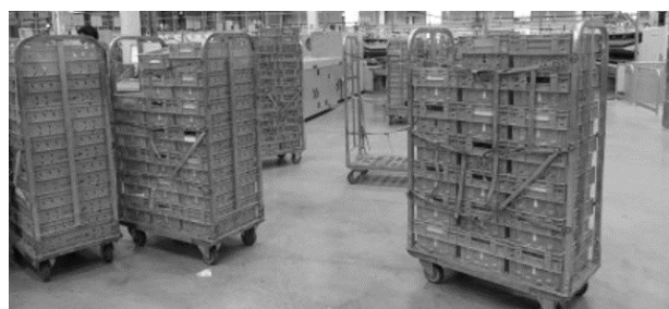
Figure 3 : Chariot de La Poste

La dernière solution que l'on peut évoquer est l'utilisation du concept de PI conteneurs issus de l'Internet Physique afin de créer un système de colisage adapté aux chariots de La Poste, le CE 30 (figure 3). Ce moyen est équipé d'un système de sécurisation des produits et d'un système de suivi et d'acheminement afin d'en assurer le suivi ainsi que l'optimisation de son parcours. De plus, c'est un outil adapté aux problèmes d'impact environnemental, il est composé de boîtes réutilisables.