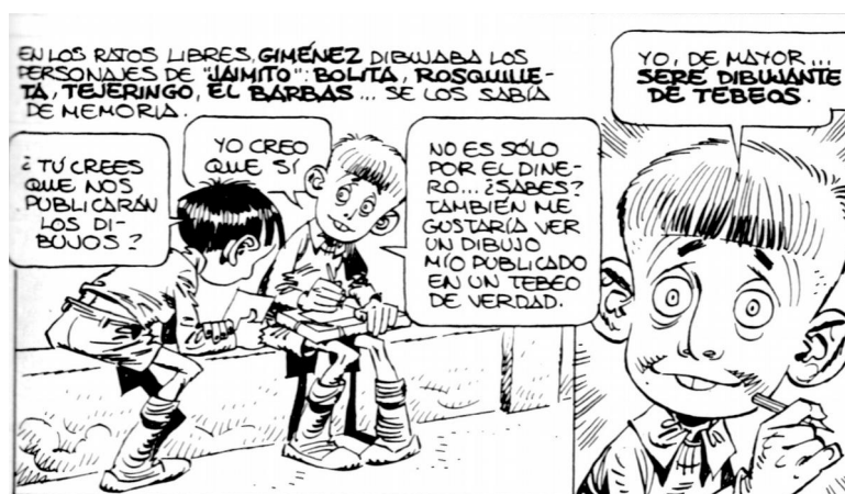
Illustration 3 : « Fruta picada » (Giménez, 1982 ; 31)

pire à devenir un jour le jeune Carlos Giménez : « Cuántas veces de niño he soñado como el Pablito de la serie » (Giménez, 2007 ; 23)