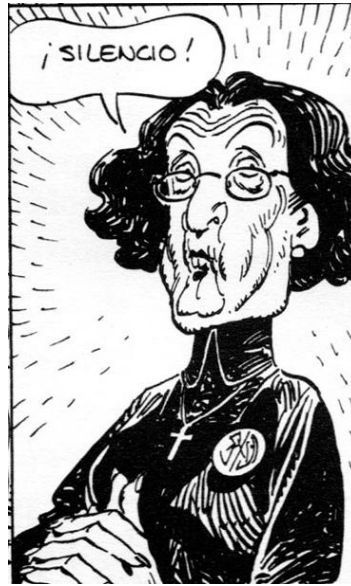
Illustration 4 : « La visita », (Giménez, 1978 ; 8)