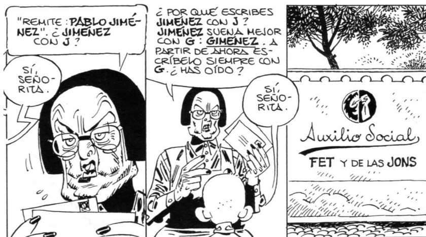
Illustration 2 : « Cartas » (Giménez, 1999 ; 9).