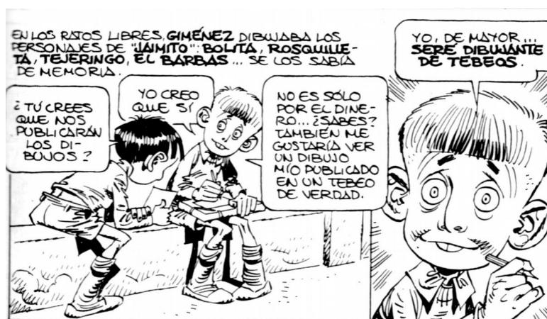
Illustration 3 : « Fruta picada » (Giménez, 1982 ; 31)

pire à devenir un jour le jeune Carlos Giménez : « Cuántas veces de niño he soñado como el Pablito de la serie » (Giménez, 2007 ; 23)