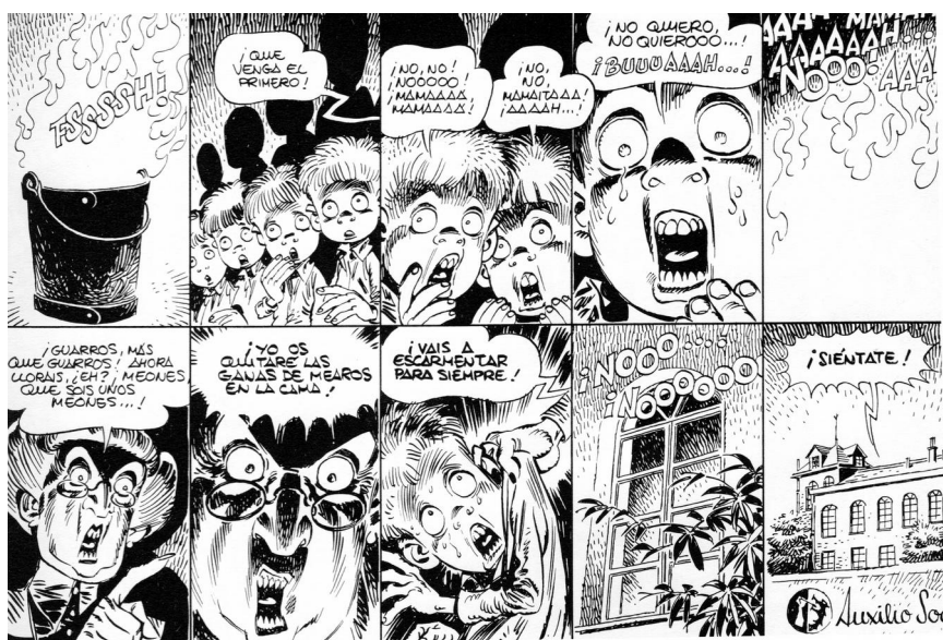
Illustration 5 : « ¡Vade retro, meón ! », (Giménez, 1978 ; 36)

l'enfant, pour qui tout semble gigantesque, et notamment lorsqu'il se trouve face aux adultes, met en exergue la verticalité des relations hiérarchiques, évidentes entre enfants et adultes. Enfin, les contrastes en noir et blanc dans nombre de vignettes, ainsi que les jeux d'ombre et de lumière, créent des clairs-obscur saisissants et renforcent l'épouvante qui émane de certaines scènes :