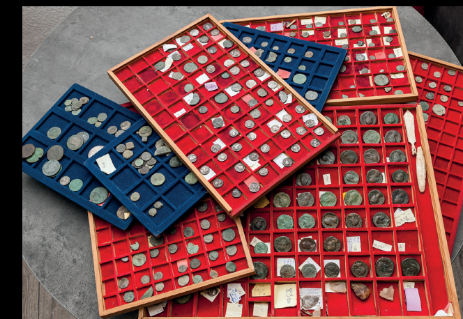
Ensemble de monnaies gauloises et romaines saisi à Grasse (Alpes-Maritimes).