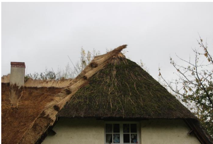
Figure 3 : Chantier du couvreur chaumier Cyrille Patin, Honfleur (région Normandie), crédit Carole Lemans.

Ainsi, malgré la vague d'uniformisation des techniques et une meilleure maîtrise des qualités du roseau, persiste tout de même des identités fortes. Comme exemple, le plan arrondi du pignon camarguais, conséquence de la forme du bâtiment et son chaume en escalier subordonné, lui, au savoir-faire du couvreur. La visière de casquette normande, en demi-croupe , réalisation du charpentier, offre la possibilité d'ouvrir en pignon (fig. 3) et permet un accès ou un balcon couvert. Les iris plantés sont, eux, du ressort du couvreur chaumier.