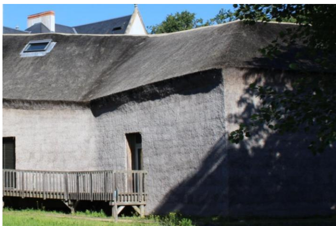
Figure 6 : Centre de découverte, Guinée Potin, La Roche-sur-Yon (Région des Pays de la Loire), crédit Carole Lemans.

Allemagne ou aux Pays-Bas, la jonction se fait par un angle net (on trouve même des angles obtus, par l'agence danoise Dorte Mandrup 31 ). Parfois le bardage et la toiture ne font qu'un et c'est par deux courbes qui se joignent au faîtage que se dessine la coupe du bâtiment 32 .