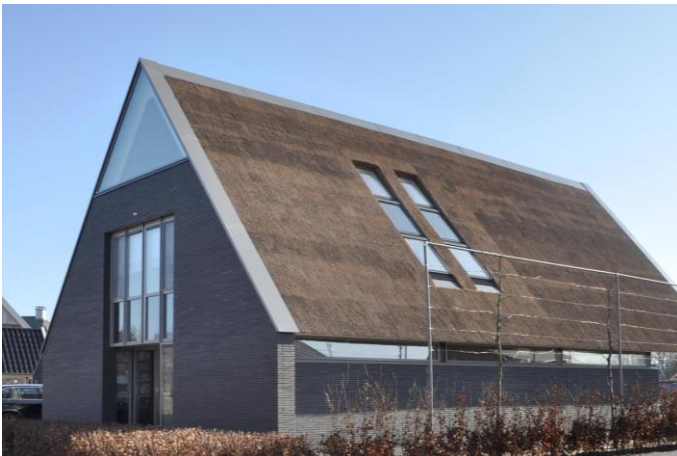
Figure 11 : Maison Hengelo (Pays-Bas), crédit ©Maas Architecten 37