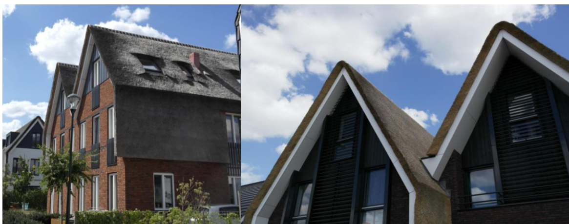
Figure 9 : Résidence pavillonnaire de Blaricummermeent (Pays-Bas), crédit Carole Lemans.

L'expression d'une architecture en chaume avec un toit en pente est fortement influencée par le dessin de son pignon. Qu'il soit en chaume ou non, le pignon est souvent outil de rupture avec la tradition. Dans le cas d'une continuité de chaume entre toit et façade, des rives de toitures avec un léger débord peuvent être utilisées pour accentuer l'idée d'un pli (fig. 9). Réinterprétation de la chaumière, cette image du manteau et de son épaisseur, soulignée par l'ombre portée, est courante aux Pays-Bas ou en Allemagne 35 .