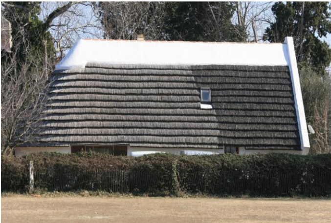
Figure 10 : Chaumière camarguaise (France), crédit ©Deuxtroy 36 .

La figure du cadre, qui contient le chaume, est une alternative qui rappelle les rives maçonnées de Camargue (fig. 10), ces bandes de chaux blanches qui forment l'arête du plan de toiture sur une dizaine de centimètres (fig. 11).