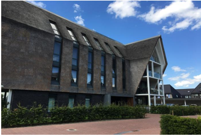
Figure 22 : Villa Blarikom, de MIX architectuur (Pays-Bas).

Si dans cette famille, la distance avec les formes traditionnelles se creuse, l'utilisation du chaume renforce la lecture de l'édifice comme maison (ou habitat) au lieu de la brouiller comme pourrait le faire la classe des radicaux. Elle redessine le toit en pente, que celui-ci se prolonge en vertical, ou qu'il se déstructure quelque peu. Nous l'avons qualifié de "recherché" parce qu'elle semble faire un effort pour se démarquer, voire pour rejeter le modèle traditionnel.