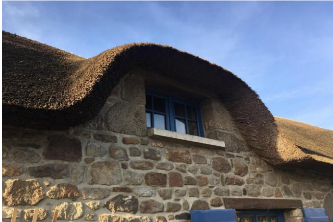
Figure 2 : Chaumière bretonne, Mont-Dol (région Bretagne), crédit Carole Lemans.

Cependant, dans les formes iconiques de chaumières régionales, les lucarnes façonnent l'expression d'une chaumière et sa particularité. En effet, les grands volumes associés à une pente de toiture importante incitent à exploiter l'espace des combles comme lieu de vie, et d'y faire entrer la lumière. La souplesse du chaume permet de réaliser à cette occasion des surfaces arrondies. La chaumière bretonne, par exemple, est reconnaissable par l'ondulation de son égout (fig. 2). En découvrant une partie plus importante de façade, elle dégagerait assez d'espace pour une ouverture à l'étage.