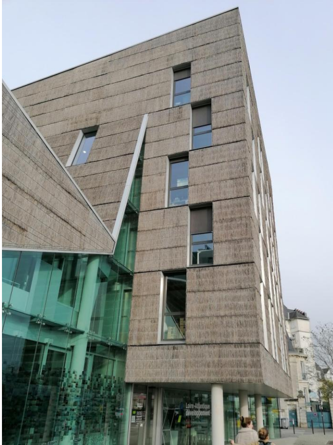
Figure 16 : Damier de chaume, de Forma6 (France), crédit Sylvain Germond.

La deuxième famille (fig. 17) contient tous les édifices à toits inclinés de cette classe, rassemblés sous le genre "expérimental", car ils présentent tous une innovation (technique ou morphologique). Tous isolés d'un tissu bâti et associés à l'idée de vie sauvage, leur bardage en chaume, qui couvre tous les murs, descend jusqu'au rez-de-chaussée : ce sont des "cloches de chaume".