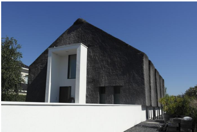
Figure 5 : Living on the edge, d'Arjen Reas, Zoetermeer (Pays-Bas), crédit Carole Lemans.

Cela représente 57% de l'ensemble du corpus et 66,7% des spécimens localisés aux Pays-Bas. A titre d'exemple, la maison living on the edge d'Arjen Reas 29 (fig. 5) fait l'objet de plusieurs publications et est une des premières références proposées par les moteurs de recherche.