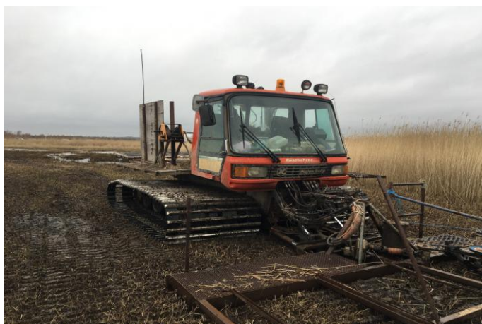
Figure 4 : Machine de coupe de la famille Bellamy, réserve naturelle de l'Estuaire de la Seine (Région Normandie).

Elles sont aujourd'hui principalement présentes sur les terres des parcs naturels où elles sont entretenues pour leur capacité à accueillir la nidification des oiseaux migrateurs 13 . La forte capacité d'expansion peut faire du roseau un envahisseur nuisible et il est ainsi nécessaire de le couper régulièrement, idéalement chaque année, pour ne pas qu'il étouffe les sols. La coupe destinée au chaume se fait en hiver après les premiers gels, pour se débarrasser des feuilles. La récolte est délicate, souvent les pieds dans l'eau, les machines sont artisanales (fig. 4) et peu adaptées (dameuse à neige re-modifiée et tracteurs avec roues cages) 14 .