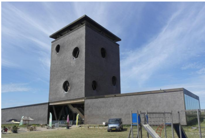
Figure 13 : Informatiecentrum Grevelingen, Ouddorp (Pays-Bas), crédit Carole Lemans.

Quand le toit est plat, il reste perceptible par la matérialisation de la corniche ou de son acrotère, qui symbolise l'idée de toiture et marque la fin de la façade. Ceci est d'autant plus vrai avec le chaume en bardage vertical puisque comme le faîtage, il doit être impérativement protégé en tête (fig. 13).