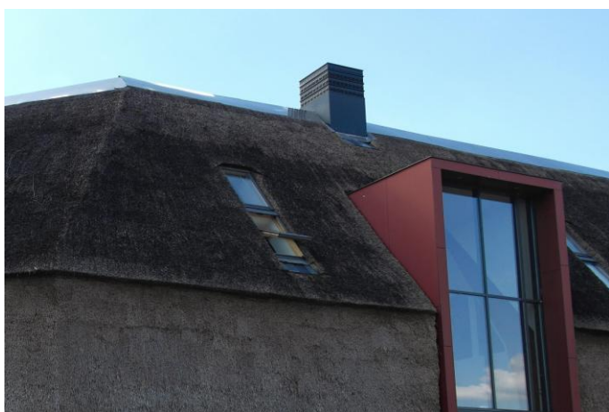
Figure 8 : Hybridation et ondulation de l'égout, Blaricummermeent (Pays-Bas), crédit Carole Lemans.

Par ailleurs, notamment en Allemagne et aux Pays-Bas, l'ouverture peut être traitée comme phénomène extérieur au chaume, lequel contourne alors la baie en restant lisse et continu (fig. 8). C'est ainsi que 27% des spécimens présentent des lucarnes pendantes, sur l'exemple de la chaumière bretonne mais sans la complexité de la vague d'égout. Traitées avec une autre matérialité et une forme souvent orthogonale, elles donnent l'image d'une boîte rectangulaire s'encastrant dans une toiture de chaume.