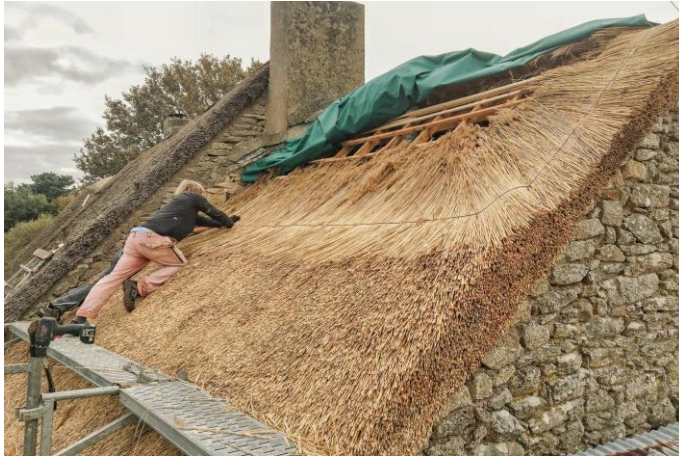
Figure 1 : Chantier avec Philippe Luce et Sébastien Le Net, Marzan (Région Bretagne), crédit Carole Lemans.

deux pans, par exemple, nécessite la mise en place de petits faîtages pour chacune des fenêtres. Chaque botte de roseau étant protégée par celles qui la recouvrent (fig. 1), il est aussi nécessaire de protéger les dernières strates qui se rejoignent au faîtage. Les matériaux les plus utilisés sont la tuile, le mortier de terre et/ou de chaux avec l'ajout éventuel de plantes racinaires, ou bien le roseau ou le miscanthus lui-même tissé avec une technique particulière dite à l'anglaise. Cet angle de toiture important a pour corollaire une épaisseur de bâtiment limitée pour que la hauteur du toit et le "volume perdu" reste raisonnable. Ceci invite à adopter un plan longitudinal. Cependant le chaume s'adapte parfaitement à des plans non rectangulaires ou courbes (comme en Camargue ou sur les cases rondes africaines, amérindiennes, asiatiques).