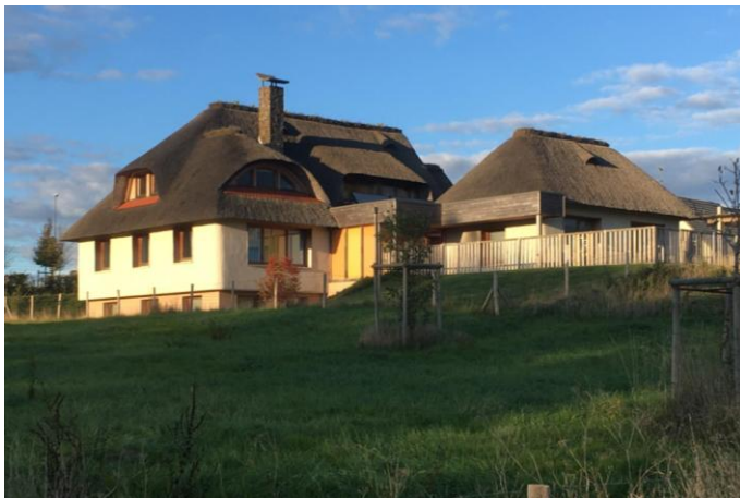
Figure 20 : Crèche, de Archipel Zero (France).

Les quatre variétés du genre "inspiration traditionnelle" sont baptisés respectivement "néo-vernaculaire à lucarnes" (fig. 20) (qui contient la chaumière traditionnelle normande), "néo-vernaculaire simple" (qui contient les deux chaumières de Camargue et de Bretagne), "le toit avant tout" (pour leur toit pregnant qui descend très bas), et enfin "esprit moderne" (pour la place accordée au verre, et aux volumes géométriques et anguleux).