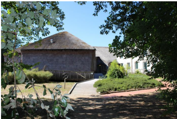
Figure 17 : Centre de découverte, de Guinée Potin, La Roche-sur-Yon (Région des Pays de la Loire), crédit Carole Lemans.

La deuxième famille (fig. 17) contient tous les édifices à toits inclinés de cette classe, rassemblés sous le genre "expérimental", car ils présentent tous une innovation (technique ou morphologique). Tous isolés d'un tissu bâti et associés à l'idée de vie sauvage, leur bardage en chaume, qui couvre tous les murs, descend jusqu'au rez-de-chaussée : ce sont des "cloches de chaume".