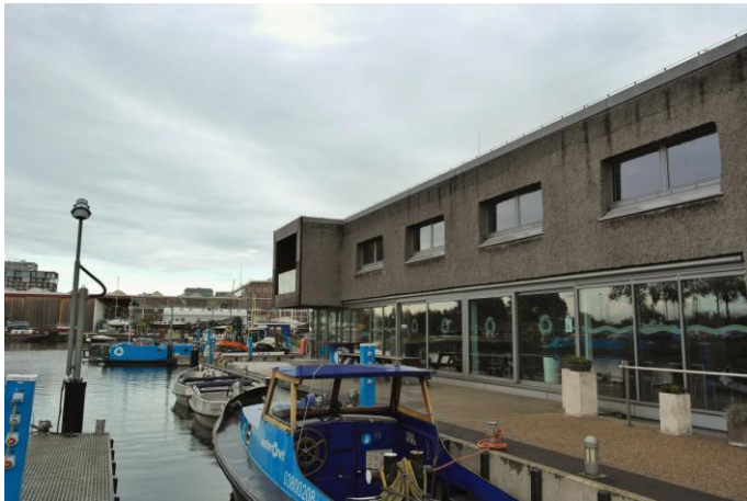
Figure 18 : Bureaux flottants, de Attika (Pays-Bas).

établissements recevant du public (fig. 18), et bois pour les maisons individuelles.