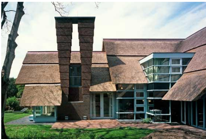
Figure 21 : Maison Bergen (Pays-Bas), crédit ©Sjoerd Soeters 39 .

Contrairement à la grande majorité de cette famille, le premier genre ne contient que deux édifices avec le chaume en vertical, et c'est par continuité avec un toit courbe. En revanche, la rive du toit est visible en pignon pour 90% d'entre eux, et se prolonge en débord. Le faîtage est traité en métal ou tuile. Les toitures souvent chahutées, complexes, interrompues par de grandes ouvertures ou transpercées de volumes géométriques (fig. 21) ont inspiré le terme "audacieux" pour caractériser ce genre.