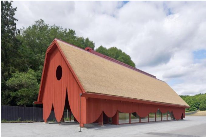
Figure 19 : Outdoor EriksbergTrensum, de Sandellsandberg (Suède), crédit DETAIL 38 .

Les quatre variétés du genre "inspiration traditionnelle" sont baptisés respectivement "néo-vernaculaire à lucarnes" (fig. 20) (qui contient la chaumière traditionnelle normande), "néo-vernaculaire simple" (qui contient les deux chaumières de Camargue et de Bretagne), "le toit avant tout" (pour leur toit pregnant qui descend très bas), et enfin "esprit moderne" (pour la place accordée au verre, et aux volumes géométriques et anguleux).