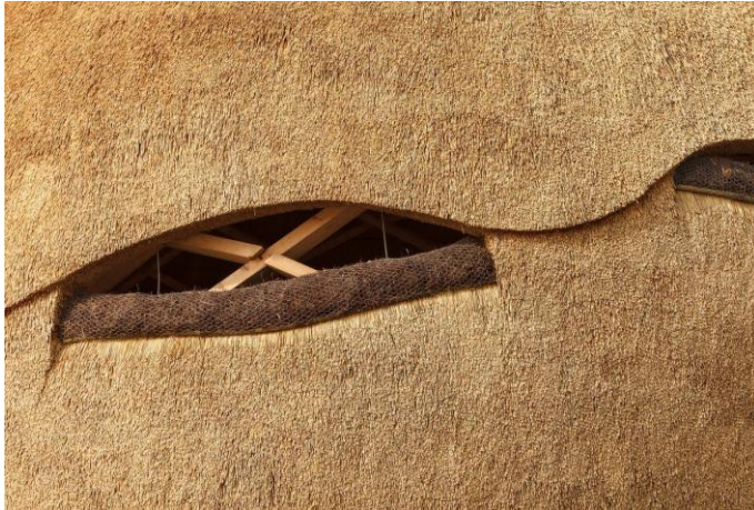
Figure 9 : Tij Observatory, de RAU architects et RO&AD Architecten, Stellendam (Pays-Bas), crédit ©Katja Effting.

Quand le toit est plat, il reste perceptible par la matérialisation de la corniche ou de son acrotère, qui symbolise l'idée de toiture et marque la fin de la façade. Ceci est d'autant plus vrai avec le chaume en bardage vertical puisque comme le faîtage, il doit être impérativement protégé en tête (fig. 13).