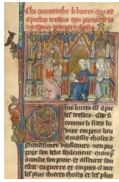
Manuscrit de Li livres dou Tresor , 1 ère page du livre I, chapitre 1 2 (Picardie, vers 1315-1325)

en exil en France (1260-1267) : Brunetto Latini , maître à penser de Dante 1