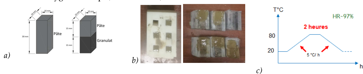
FIGURE 1. a) Dimensions des éprouvettes de pâte de ciment et de composite, b) Moules verticaux (à gauche) et horizontaux (à droite) utilisés, c) Cycle thermique et humidité relative appliqués.

Afin d'accélérer l'apparition de la pathologie, les échantillons subissent un traitement hygrothermique, juste après leur fabrication, dans une enceinte climatique « Weiss » qui permet d'imposer les cycles thermique et hydrique souhaités. Une étude récente, réalisée par Jebli et al. (2018a), a permis de retenir un cycle hygrothermique pour les éprouvettes de petites dimensions. Ce cycle consiste à maintenir une humidité relative proche de 97% et de réaliser une montée en température de 5°C/heure, suivie d'un palier de 2 heures à 80°C, puis d'une descente de 5°C/heure (Fig. 1c). Après le cycle hygrothermique, les éprouvettes sont conservées dans un bac d'eau déminéralisée de 25 litres à une température de 38°C. Les échantillons n'ayant pas subi un traitement hygrothermique, dits « sains », sont conservés dans de l'eau saturée en chaux.