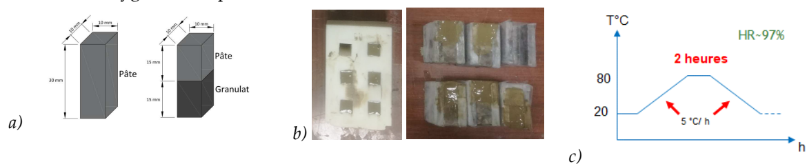
FIGURE 1. a) Dimensions des éprouvettes de pâte de ciment et de composite, b) Moules verticaux (à gauche) et horizontaux (à droite) utilisés, c) Cycle thermique et humidité relative appliqués.

Afin d'accélérer l'apparition de la pathologie, les échantillons subissent un traitement hygrothermique, juste après leur fabrication, dans une enceinte climatique « Weiss » qui permet d'imposer les cycles thermique et hydrique souhaités. Une étude récente, réalisée par Jebli et al. (2018a), a permis de retenir un cycle hygrothermique pour les éprouvettes de petites dimensions. Ce cycle consiste à maintenir une humidité relative proche de 97% et de réaliser une montée en température de 5°C/heure, suivie d'un palier de 2 heures à 80°C, puis d'une descente de 5°C/heure (Fig. 1c). Après le cycle hygrothermique, les éprouvettes sont conservées dans un bac d'eau déminéralisée de 25 litres à une température de 38°C. Les échantillons n'ayant pas subi un traitement hygrothermique, dits « sains », sont conservés dans de l'eau saturée en chaux.