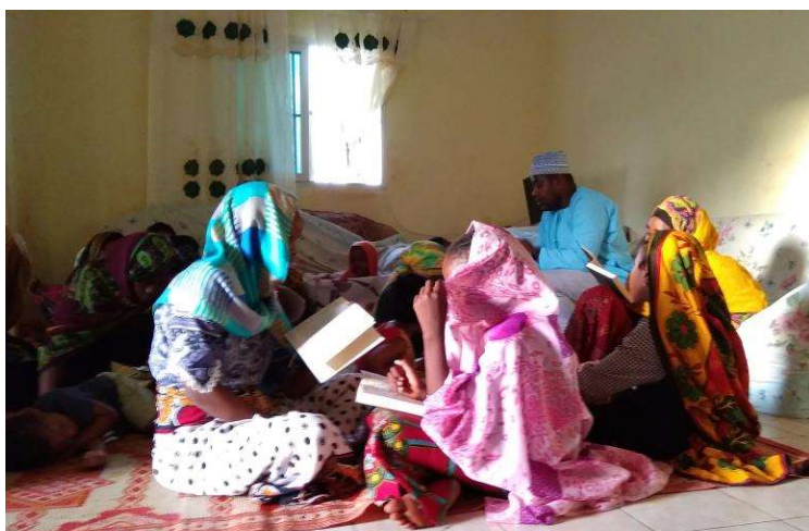
Cours dans un sbioni à Tsingoni Le fundi (à droite) fait réciter un élève assis devant lui, pendant que les autres continuent à mémoriser le passage qu'ils devront à leur tour réciter.

importants, puis de certaines sourates complètes. Plus le niveau augmente, plus les exercices s'intensifient, et tendent vers la mémorisation totale des trente juz (divisions) que comprennent le Coran. Ainsi, « lecture et écriture apparaissent subordonnées à la mémorisation et à la récitation qui constituent la finalité de l'enseignement coranique » (Fortier 2003, 250). Les observations menées dans deux sbionis ont en effet confirmé qu'une grande partie des activités est centrée sur ce travail de