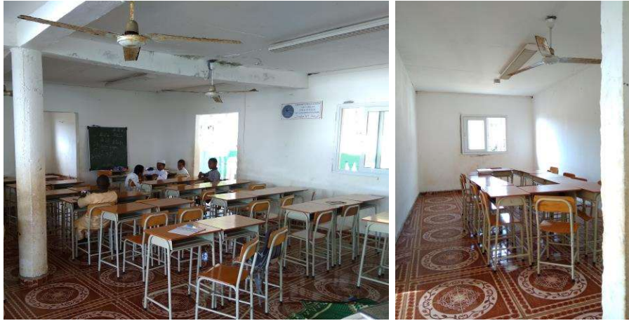
Photographies d'une madrasa située à l'étage de la mosquée de Chembényoumba (2-3 enseignants, 4 salles).