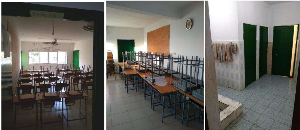
Photographies de l'une des madrassas de Sada (12 enseignant·es, 12 salles, 560 élèves)

Contrairement à ce qu'explique l'anthropologue Corinne Fortier à propos des écoles coraniques mauritaniennes – en remettant en cause le terme même d' école (Fortier 2003, 236) –, les salles de cours des madrassas mahoraises ressemblent très largement aux classes