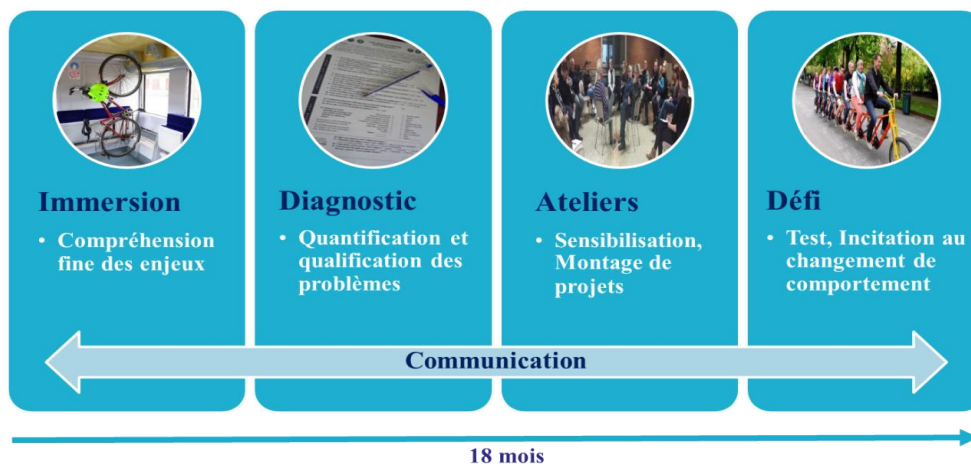
Figure 1 : Méthodologie du projet