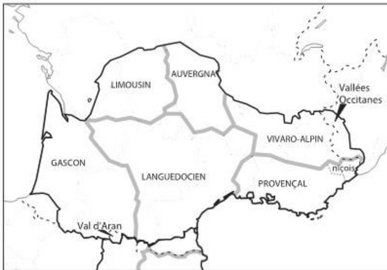
Carte linguistique de l'occitan

La carte qui suit, extraite du Précis d'occitan et catalan , permet de voir à la fois l'extension de l'espace linguistique occitan, situé essentiellement dans l'état français, avec quelques territoires côté espagnol et italien. Elle montre également les grandes variétés dialectales de l'occitan communément reconnues.