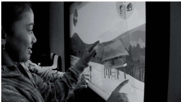
Figure 2. Atelier Muséo sur écran multitouch