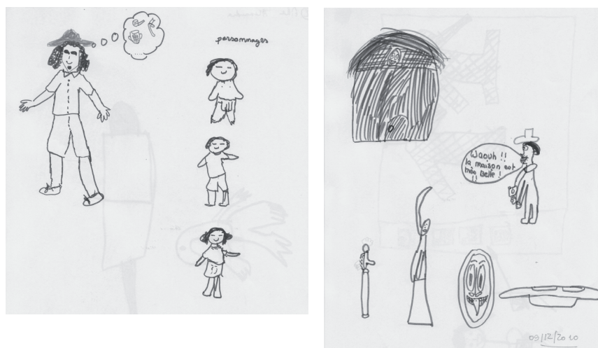
Figure 4. Exemples de dessins produits par les enfants

En conclusion, dans la démarche d'appropriation de contenus que les sujets ont expérimentée, l'interposition d'un signeur humain ne contribue pas à l'amélioration de l'apprentissage. Les résultats montrent clairement que, dans le cas particulier qui est le nôtre, la visite sur iPad permet aux enfants sourds de capter plus vite le contenu et de se l'approprier davantage qu'en procédant à une visite classique.