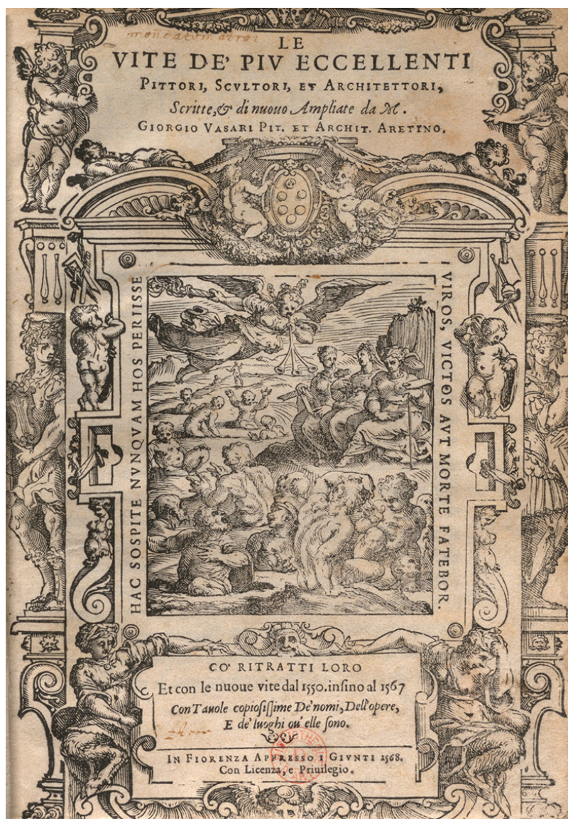
Figure 4. Giorgio Vasari, Le vite de' più eccellenti pittori, scultori, e architettori , Florence, 1568, 3 vol., I, page de titre avec xylographie allégorique de la Renommée. Paris, bibliothèque de l'INHA, fonds BAA, 8 Res 148 (1).

en effet présentée dans son deuxième état, plus rare, dans lequel une gravure sur bois représentant une allégorie de la Renommée est encadrée au milieu de la page 20 (fig. 4).