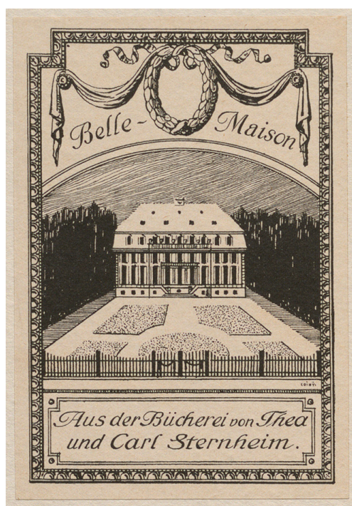
Figure 7. Ex-libris de Carl et Thea Sternheim. Alfred Lys Baldry, Sir Joshua Reynolds , Londres, 1903. Paris, bibliothèque de l'INHA, fonds BCMN, 8 H 0841.