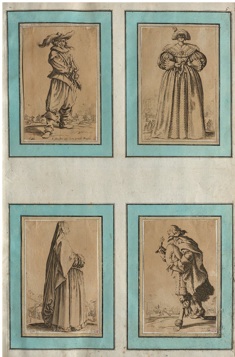
Figure 1. Jacques Callot, La noblesse , eau-forte, Paris, éd. Charles Bance, entre 1789 et 1792. Paris, bibliothèque de l'INHA, fonds BAA, Fol Est 125.

de 50 dessins originaux de Léo Leléé ayant servi à l'illustration de La louange du cyprès , publié en 1928 aux éditions de Plantin (fig. 2).