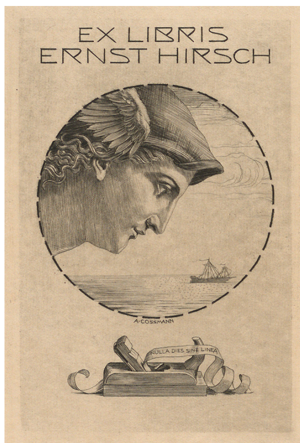
Figure 6. Ex-libris d'Ernst Hirsch. Hermann Schmitz, Das Möbelwerk: die Möbelformen vom Altertum bis zur Mitte des 19. Jahrhunderts , Berlin, 1929. Paris, bibliothèque de l'INHA, fonds BCMN, 4 M 0070.