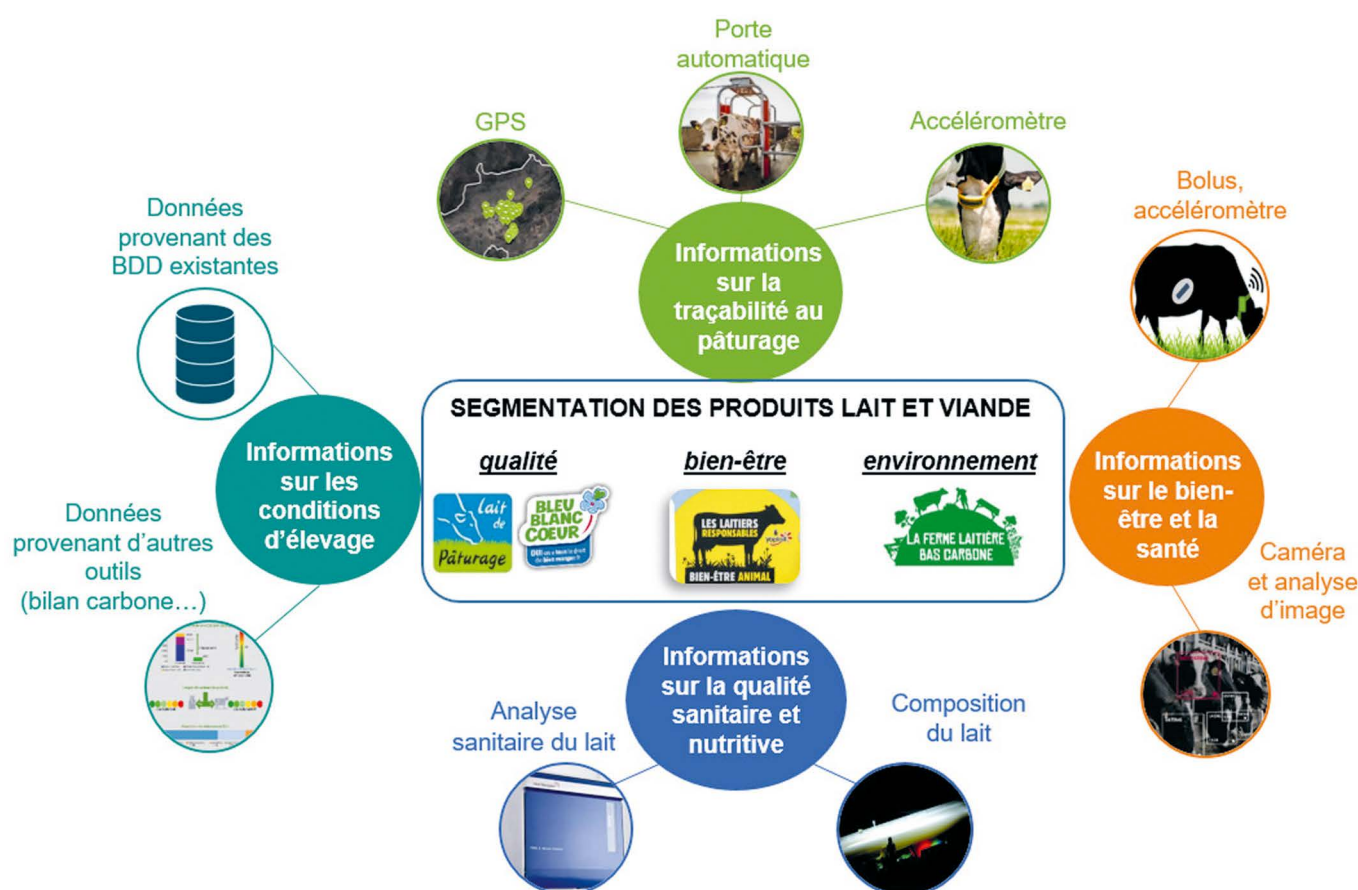
Figure 2. Exemples de segmentations possibles des produits lait et viande et sources des données qui permettraient une objectivation du respect des cahiers des charges.

La sélection génétique nécessite de collecter beaucoup d'informations phénotypiques associées à l'information génétique des animaux. La remontée des données vers les centres de sélection permettrait de proposer de nouveaux index à partir de l'information génomique, comme en témoigne l'indexation génomique sur les risques d'acétonémie des vaches laitières actuellement disponible (Barbat-Leterrier et al. , 2016). Des paramètres enregistrés en routine par des automatismes comme les robots de traite, tels que la vitesse de traite (Heringstad et Bugten, 2014), les débits de matière