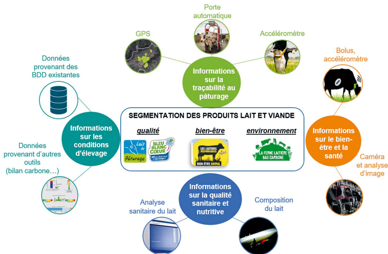
Figure 2. Exemples de segmentations possibles des produits lait et viande et sources des données qui permettraient une objectivation du respect des cahiers des charges.

La sélection génétique nécessite de collecter beaucoup d'informations phénotypiques associées à l'information génétique des animaux. La remontée des données vers les centres de sélection permettrait de proposer de nouveaux index à partir de l'information génomique, comme en témoigne l'indexation génomique sur les risques d'acétonémie des vaches laitières actuellement disponible (Barbat-Leterrier et al. , 2016). Des paramètres enregistrés en routine par des automatismes comme les robots de traite, tels que la vitesse de traite (Heringstad et Bugten, 2014), les débits de matière