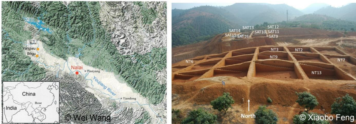
Figure 1. Localisation géographique des sites préhistoriques du bassin de Bose en Chine et vue générale du site de Nalai étudié dans ce travail.

Les tectites sont des verres naturels contenant du potassium permettant la datation ^{40}\text{Ar}/^{39}\text{Ar} dérivée de la méthode K-Ar, formés par la fusion de la croûte continentale lors de l'impact d'une météorite. La composition des éléments majeurs des tectites, déterminée à l'Institut de Recherche sur les Archéomatériaux (IRAMAT - CNRS / COMUE UBFC / Univ. Orléans / Univ Bordeaux Montaigne), montre qu'elles appartiennent au groupe des tectites australasiennes dispersées dans les vastes régions de l'Asie, l'Australie et l'Antarctique, à la suite de l'impact d'une météorite situé en Indochine ou au sud du Laos, il y a 790 000 ans. A Nalai, l'outillage et les tectites proviennent des mêmes sédiments latérisés des niveaux supérieurs de la terrasse T4. Le site s'étend sur 30 000 m 2 , et plus de 3 000 outils et 300 tectites y ont été découverts. La datation par la méthode ^{40}\text{Ar}/^{39}\text{Ar} de quatre tectites découvertes en étroite association avec des bifaces et par conséquent contemporains, a été appliquée par Fusion Totale (TF) (Géoazur - CNRS / OCA / IRD) (Figure 2).