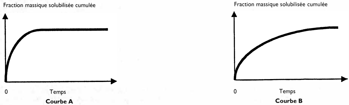
Figure 2 : Fraction cumulée d'un élément solubilisé par lixiviation à l'eau déminéralisée du déchet traité

Selon les éléments, les courbes de solubilisation dans l'eau déminéralisée en fonction du temps présentent deux aspects (courbes A et B sur la figure 2).