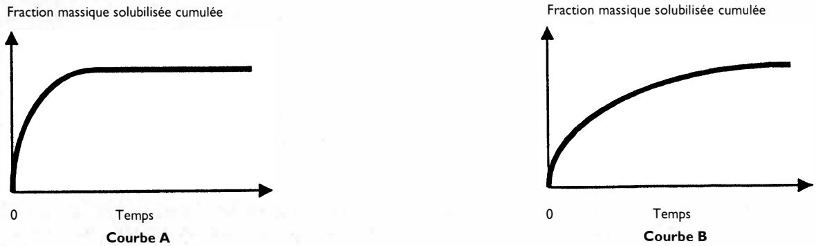
Figure 2 : Fraction cumulée d'un élément solubilisé par lixiviation à l'eau déminéralisée du déchet traité

Selon les éléments, les courbes de solubilisation dans l'eau déminéralisée en fonction du temps présentent deux aspects (courbes A et B sur la figure 2).