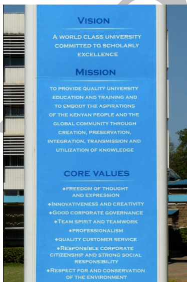
Les trois fétiches « vision », « mission » et « core values » placés à l'entrée du campus principal de l'UoN. 01/01/2012, Nairobi