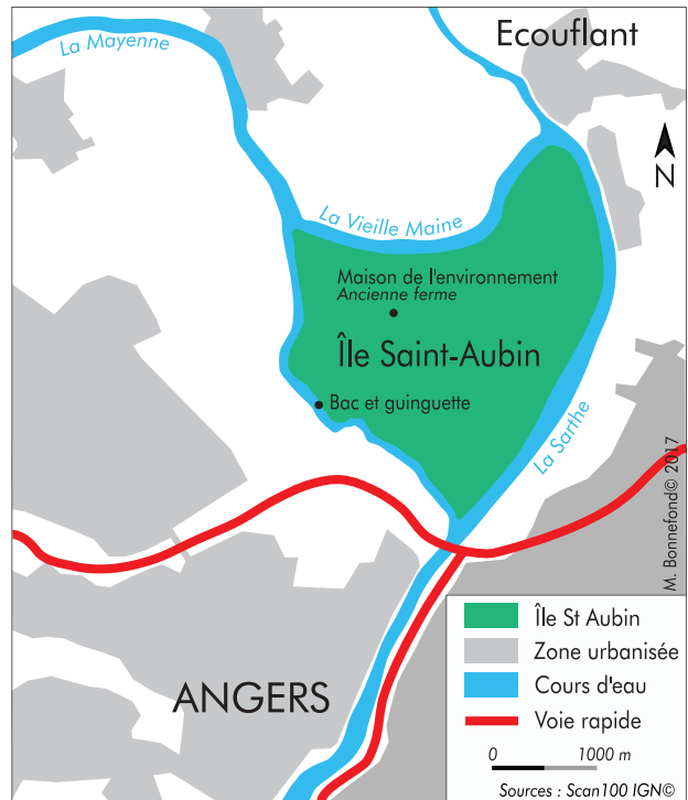
FIGURE 1 – Localisation de l'île Saint-Aubin

L'île Saint-Aubin, qui s'étend sur près de 600 ha, est située dans les basses vallées angevines, plaines alluviales inondables de 10 000 ha, proches d'Angers, au confluent de deux rivières, la Mayenne et la Sarthe. Aménagée et drainée à partir du Moyen Âge par une communauté monacale, l'île a conservé jusqu'à aujourd'hui une vocation agricole forte. Après la Révolution française et la confiscation de ses terres au clergé, l'île est découpée par la commune d'Angers en parcelles étroites qui sont vendues aux particuliers. Sur ces terres humides, potentiellement inondées plusieurs semaines en période hivernale, seules les activités de pâturage bovin extensif et de fauche se sont maintenues sur le long terme et jusqu'à la seconde moitié du xx e siècle. À partir des années 1970 néanmoins, l'activité agricole commence à décliner, entraînant un abandon des terres et des mouvements importants de vente du parcellaire. Certains propriétaires s'engagent éga-