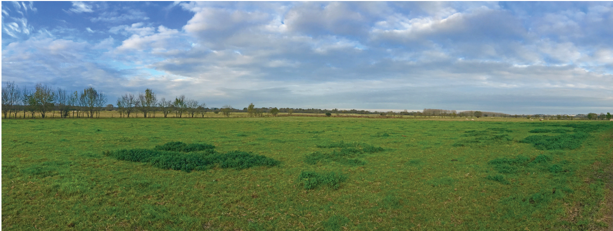
FIGURE 2 – Paysage de prairie de l'île Saint-Aubin