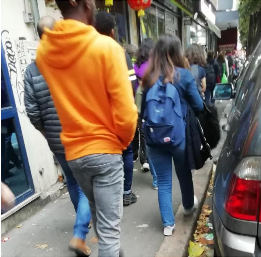
Figure 1 : Rue Paul Vaillant-Couturier, Vitry sur Seine (RD155), septembre-octobre 2019 : un fort trafic piéton, ici de collégiens, dans des conditions inconfortables