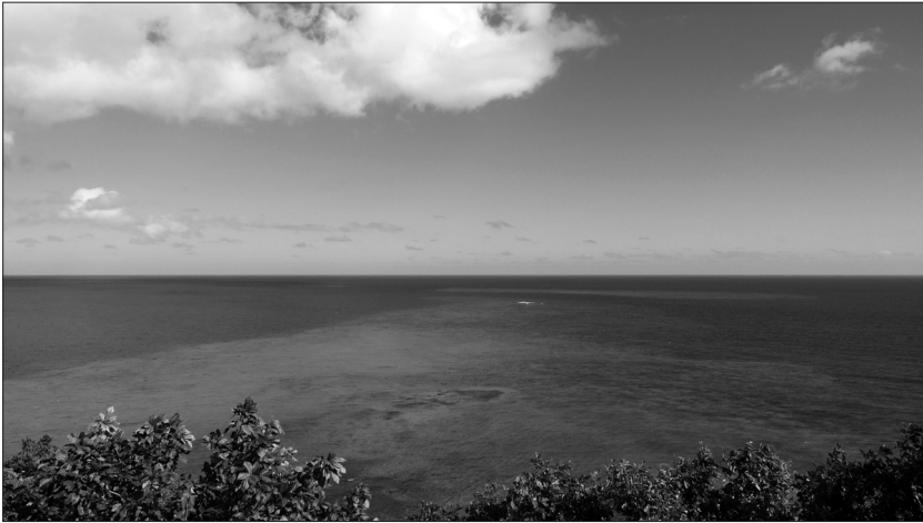
FIGURE 2. – Vue sur le lagon décrite par la personne interrogée ME11H34PA.