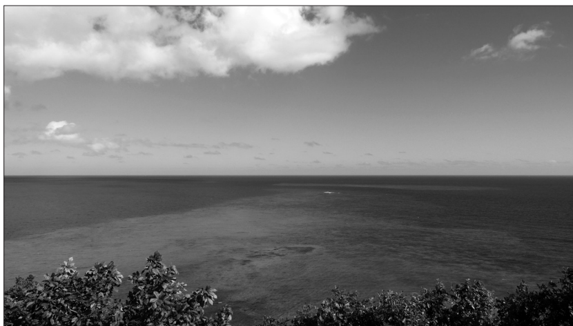
FIGURE 2. – Vue sur le lagon décrite par la personne interrogée ME11H34PA.