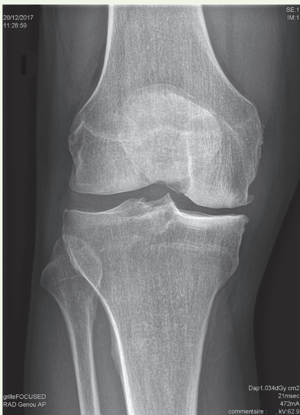
Figure 1. Radiographie de genoux montrant la perte d'épaisseur de cartilage avec début de pincement (à droite) par rapport à la zone saine (à gauche).

révélé une accumulation transitoire de cellules sénescents à 14 jours après la chirurgie. L'analyse des genoux arthrosiques, par immunomarquage, a également permis de détecter des cellules sénescents dans la synoviale activée et dans les zones superficielles du cartilage. Afin de déterminer si ces cellules sénescents articulaires jouent un rôle actif dans l'apparition de l'arthrose, des injections intra-articulaires de ganciclovir ont été réalisées dans le genou des animaux ayant subi la chirurgie. De façon remarquable, l'élimination locale des cellules sénescents s'est avérée être associée à une moindre dégradation du cartilage, une moindre expression articulaire de molécules inflammatoires telles que l'IL(interleukine)-1 \beta et à une diminution de l'expression des molécules cataboliques hypertrophiques comme MMP-13 ( matrix metalloproteinase-13 , ou collagenase-3 ). L'un des principaux intérêts de cette étude était de trouver, chez les souris traitées, un niveau d'expression plus élevé de deux marqueurs pro-chondrogéniques, à savoir le collagène de type II \alpha 1 et l'aggrécane 5 . Pour apporter un autre argument convaincant, les auteurs ont utilisé le second modèle transgénique INK-ATTAC afin d'étudier l'apparition spontanée de l'arthrose chez des souris âgées. Fait remarquable, le traitement par AP20187, administré à ces souris INK-ATTAC dès