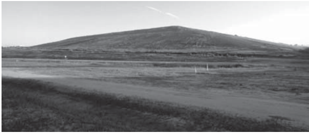
Décharge couverte en phase de suivi.

servitudes interdisent l'implantation de constructions et ouvrages et limitent l'usage du sol. Bien qu'elles soient moins fortes, des servitudes continuent également à peser sur la zone correspondant au périmètre de protection.