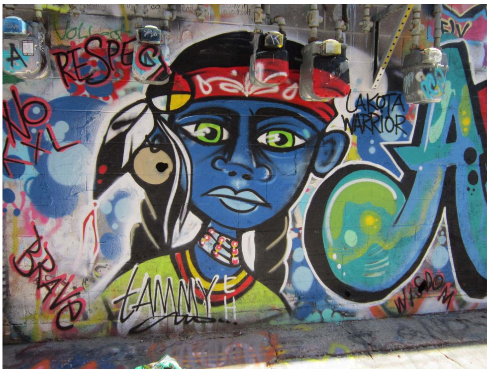
Graffiti d'une artiste lakota dans Art Alley, 12 juillet 2015