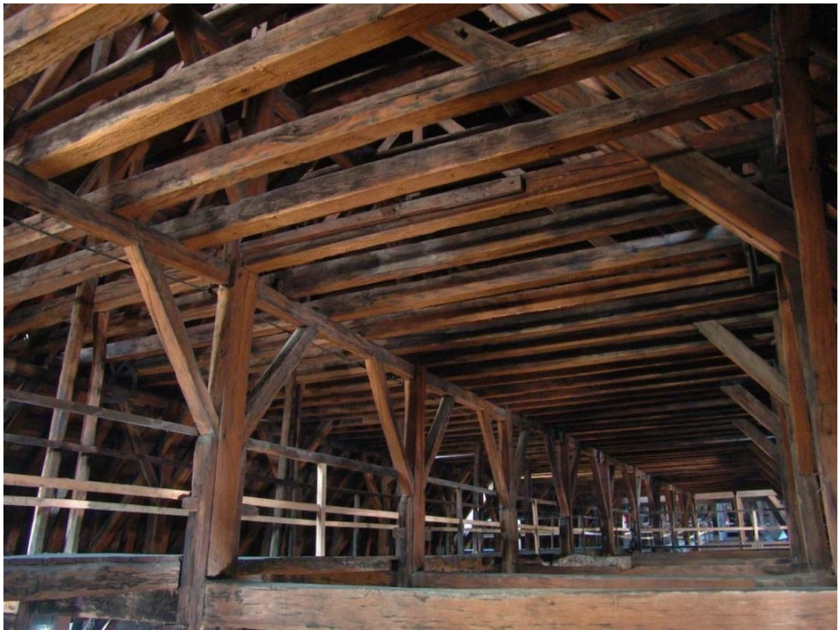
Cathédrale Notre-Dame de Paris, charpente de la nef.

Suite à l'émotion suscitée par l'incendie de Notre-Dame, de nombreux commentaires contradictoires ont circulé à propos de la charpente disparue, des bois qu'il fallait sécher plusieurs années pour être utilisés et des forêts entières qu'il fallait raser pour la construire ou la reconstruire. Il est donc utile de faire un état des connaissances sur la charpente et les bois utilisés à Notre-Dame au XIIIe siècle ainsi que sur les possibilités de reconstruire une charpente en bois selon les techniques en vigueur au Moyen Âge.