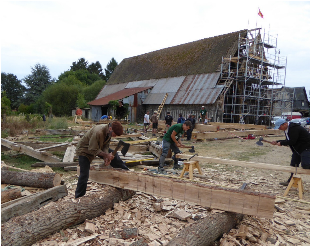
Chantier traditionnel « Charpentiers sans frontière », Aclou (Eure), 2016.

écologique, et travaillé manuellement avec une empreinte carbone quasi nulle, selon des préoccupations somme toute très ancrées dans le XXI e siècle.