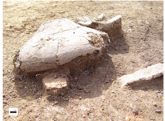
Fig. 5. – Céramique dans la fosse 6017 sur le site de Ville-St Jacques.

que en question et l'autre une fraction complémentaire de l'unité stratigraphique 1, juste en dessous du vase. Les densités en carpo-restes s'y élèvent respectivement à 34 et 19 restes par litre, composés essentiellement de semences de caméline. Le rapprochement entre les graines et le contenant est tentant, d'autant plus que la densité est plus forte dans le vase qu'en dessous. Il n'est pourtant ni évident ni direct car la céramique en question est une jatte de présentation à pâte fine. Son usage et sa faible résistance à la chauffe ne la destinent pas à aller sur le feu, et elle ne présente aucune trace d'une telle exposition. Rien n'interdit qu'elle ait servi dans une étape intermédiaire, entre le feu et le produit final, lors d'une préparation à base de caméline. Cependant, l'hypothèse d'une mise au rebut du vase, postérieure au rejet de la caméline, est également possible.