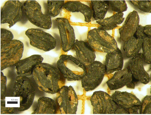
Fig. 6. – Graines fossiles de caméline provenant de la fosse 6017 de VSJ (Cl. F. Toulemonde).

Les découvertes isolées sont d'ailleurs composées majoritairement de semences entières, parfois dépourvues de leur épiderme, voire lacunaires mais assez rarement morcelées. Les phénomènes taphonomiques restent un des premiers facteurs de fragmentation, mais celle-ci peut avoir d'autres origines et résulter d'un traitement avant carbonisation, du type broyage.