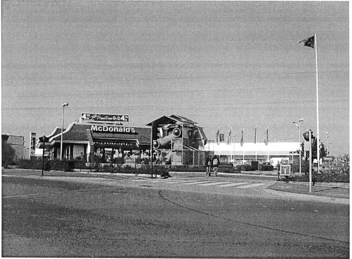
Vue du McDonald's de Corbeil