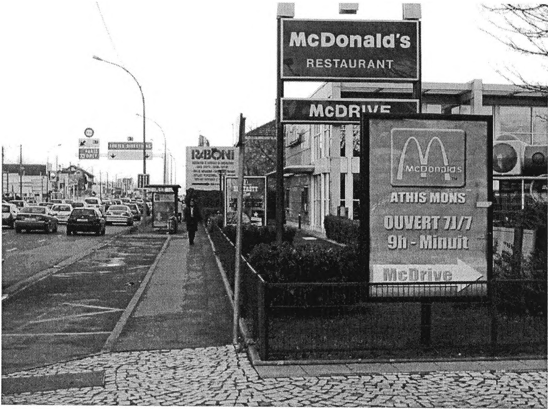
Vue du McDonald's d'Athis-Mons