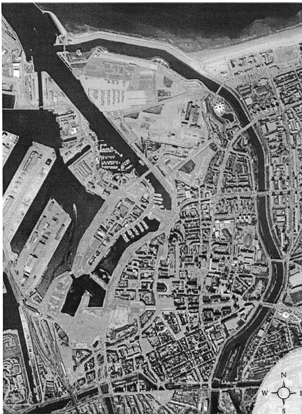
Le périmètre de Neptune : 180 ha de friches industrielo-portuaires à proximité du centre ville (source : AGUR)