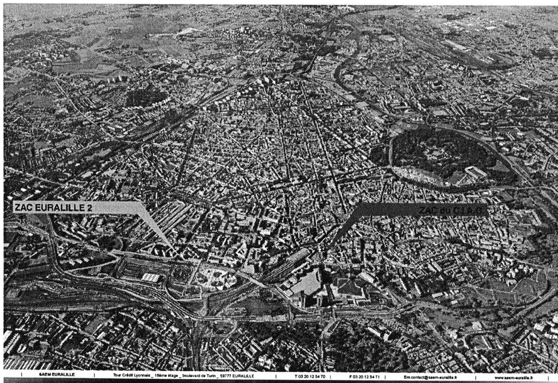
Photographie aérienne de Lille intra-muros, avec les limites des ZAC d'Euralille