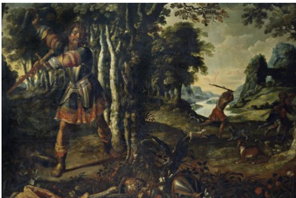
Roland au 4e jour arrache son armure (Cycle d'Effiat)

« Et fatigué à la fin, finalement trempé de sueur quand son haleine vaincue ne répond plus à son indignation, à sa haine profonde, à sa colère ardente, il tombe sur le pré et tourné vers le ciel il soupire [32] . »