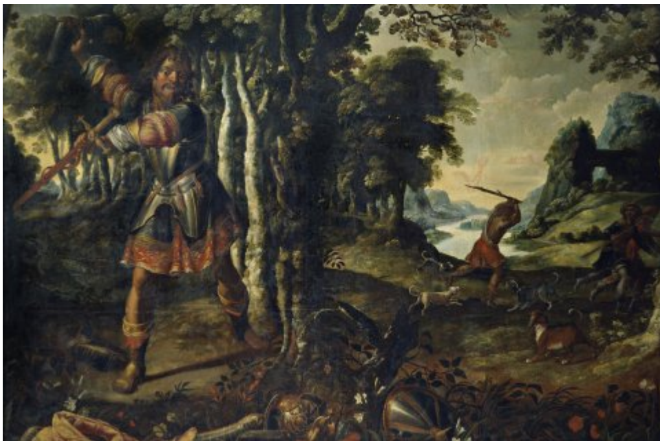
Roland au 4e jour arrache son armure (Cycle d'Effiat)

« Et fatigué à la fin, finalement trempé de sueur quand son haleine vaincue ne répond plus à son indignation, à sa haine profonde, à sa colère ardente, il tombe sur le pré et tourné vers le ciel il soupire [32] . »