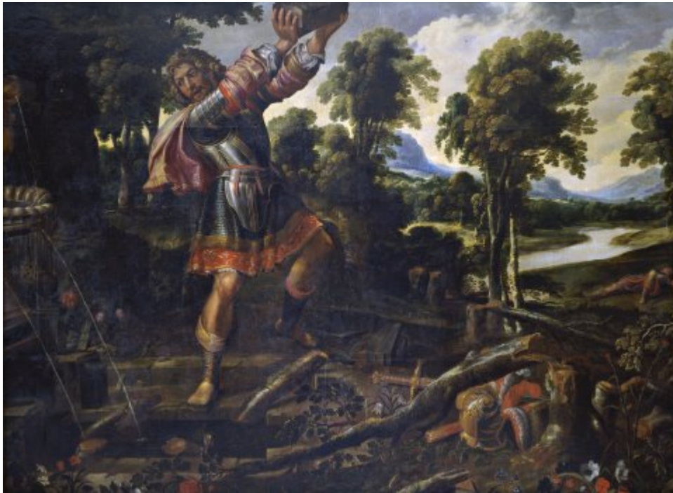
Roland détruit à mains nues la fontaine aux monogrammes (Cycle d'Effiat)

Roland détruisant la fontaine retrouve pour ainsi dire insensiblement une logique narrative. À gauche, Roland brandit un quartier de roche et s'apprête à détruire la fontaine. À l'arrière-plan à droite, le même Roland exténué, reconnaissable au liseré rouge de sa tunique, s'écroule à terre près de la rivière :