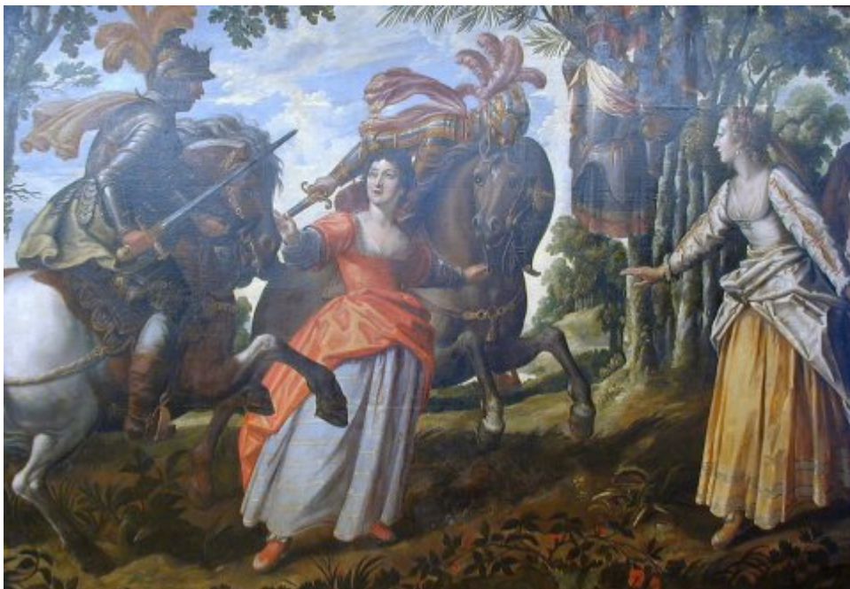
Doralice & Isabelle interrompent le duel de Mandricard & Zerbin (Cycle d'Effiat)

L'histoire d'Isabelle et de Zerbin est contée par l'Arioste au chant XXIV, dont était tiré déjà, dans le dernier des quatre tableaux consacrés à la folie de Roland, le massacre du berger. Parce que dans le récit de l'Arioste ils viennent en quelque sorte [35] en conclusion de l'épisode de la folie, Isabelle et Zerbin sont parfois associés à Angélique et Médor dans les réductions du Roland furieux pour le théâtre : en 1614 puis en 1618, Nicolas Oudot publie à Troyes deux tragédies attribuées aujourd'hui à Charles Bauter et imitées de l'Arioste, la première centrée sur Angélique et Médor, la seconde sur Zerbin et Isabelle [36] ; en 1638, Jean Mairet fond les deux intrigues en une et donne une tragicomédie du Roland furieux où Angélique et Médor d'une part, Isabelle et Zerbin d'autre part, se retrouvent dans la maison du berger au moment même du déchaînement de la folie de Roland. Le cycle d'Effiat est créé entre Bauter et Mairet, et participe du processus de transformation de la matière gothique-renaissante de l'Arioste en une fiction simplifiée, ordonnée, qui répond aux nouvelles règles classiques de composition.