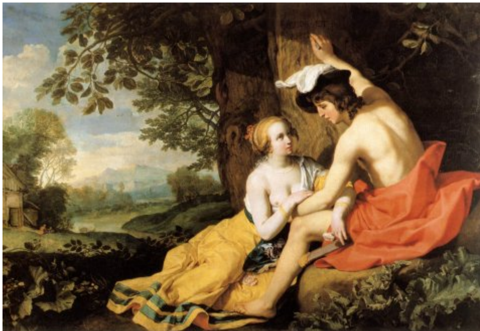
Angélique et Médor - Bloemaert

Si nous comparons l' Angélique et Médor de Toussaint Dubreuil (ill. 2), peint vers 1580, à celui d'Abraham Bloemaert (ill. 3), peint dans les années 1620, c'est-à-dire au moment où le cycle d'Effiat est réalisé, nous pouvons mesurer le changement de logique. Les deux tableaux représentent Médor gravant le chiffre des amants avec Angélique auprès de lui. Dans le tableau de Dubreuil, réalisé dans le style renaissant de l'école de Fontainebleau, tandis que Médor se concentre à droite sur son inscription et qu'Angélique languit contre lui observe avec attention son travail, Roland surgit à gauche à l'arrière-plan. Dans le récit, Roland n'apparaît dans la forêt qu'après que le couple est parti, il n'y a ni rencontre ni même simultanément des présences. Le tableau se lit donc narrativement, comme une progression dans le temps au fur et à mesure qu'on avance vers le fond de l'image.