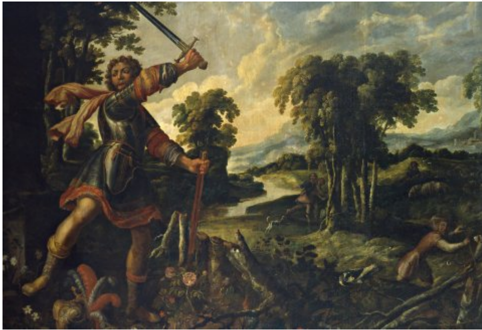
Roland dégainé Durandal contre la fontaine aux monogrammes (Cycle d'Effiat)

Les étapes de la folie suivent le texte de l'Arioste et la transformation progressive du statut de Roland : Roland dégainant Durandal contre la fontaine aux monogrammes est encore un chevalier, même s'il est déjà nu tête, son casque tombé à ses pieds (XXIII, 129-130) ; puis Durandal rejoint le casque à terre et c'est à mains nues que Roland détruit la fontaine (str. 131-132) ; puis Roland arrache son armure dans un paysage où ne subsiste plus aucune construction humaine (str. 133-134) ; enfin, torse nu, Roland arrache un arbre : il est devenu une pure force destructrice de la nature, destituée de toute humanité (str. 135-136).