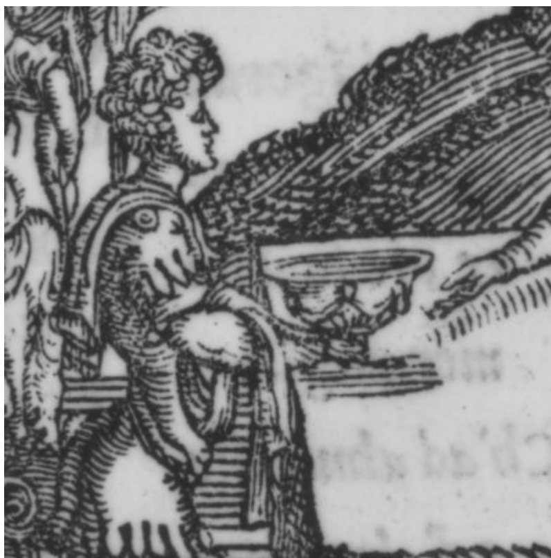
La coupe qui révèle les adultères ( Roland furieux , Valgrisi, chant 43)

chant XXVIII, on peut citer la gravure de Girolamo Porro dans l'édition de Franceschi de 1584 ( ill. 9 ), où Rodomont est attablé face à l'aubergiste de Valence ; pour le chant XLIII, on se référera de préférence à la gravure qui aurait été dessinée par Dosso Dossi dans l'édition Valgrisi de 1556 ( ill. 10 ), où un valet, à gauche, apporte à Renaud attablé, à droite, la coupe de Mélisse que son hôte, debout à ses côtés, l'invite à boire. Ces deux gravures obéissent aux règles d'une composition narrative, et représentent donc à l'arrière-plan plusieurs fois le protagoniste (Rodomont, puis Renaud) dans ses pérégrinations ultérieures : on illustre toujours le texte chronologiquement de l'avant vers l'arrière, du bas vers le haut. Dans le cycle d'Effiat pourtant, Roland descendant de cheval au second plan à droite vient avant chronologiquement et non après : les conventions de la composition narrative, désormais désuète, sont brouillées ou perdues.