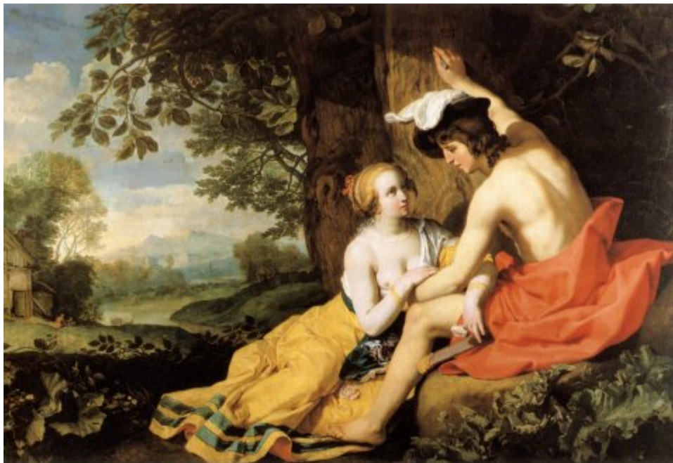
Angélique et Médor - Bloemaert

Si nous comparons l' Angélique et Médor de Toussaint Dubreuil ( ill. 2 ), peint vers 1580, à celui d'Abraham Bloemaert ( ill. 3 ), peint dans les années 1620, c'est-à-dire au moment où le cycle d'Effiat est réalisé, nous pouvons mesurer le changement de logique. Les deux tableaux représentent Médor gravant le chiffre des amants avec Angélique auprès de lui. Dans le tableau de Dubreuil, réalisé dans le style renaissant de l'école de Fontainebleau, tandis que Médor se concentre à droite sur son inscription et qu'Angélique alanguie contre lui observe avec attention son travail, Roland surgit à gauche à l'arrière-plan. Dans le récit, Roland n'apparaît dans la forêt qu'après que le couple est parti, il n'y a ni rencontre ni même simultanéité des présences. Le tableau se lit donc narrativement, comme une progression dans le temps au fur et à mesure qu'on avance vers le fond de l'image.