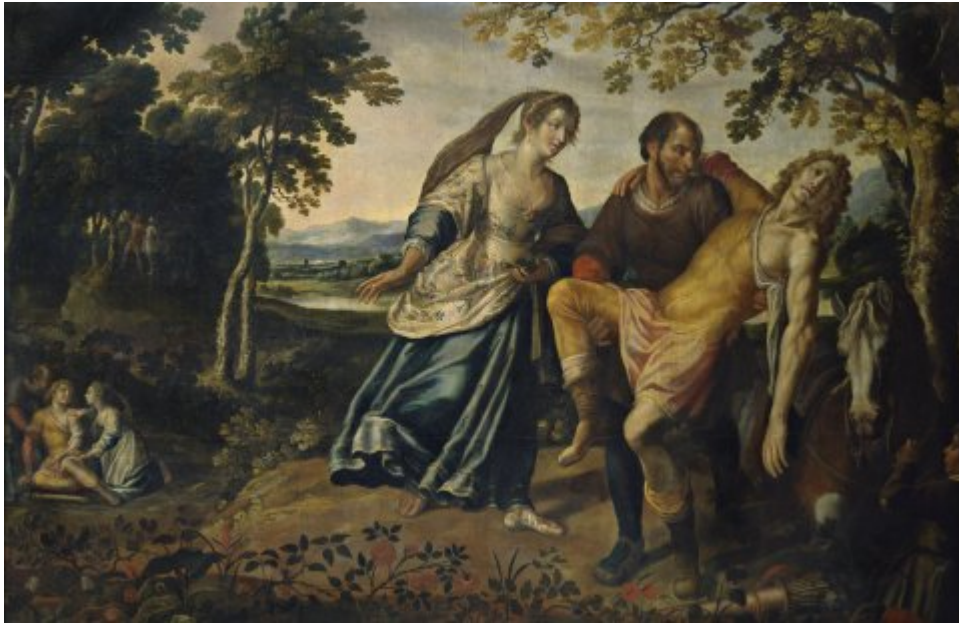
Angélique fait monter Médor sur le cheval d'un berger (Cycle d'Effiat)

d'Angélique et de Médor et la seconde sur la folie déclenchée par cette révélation, et enfin deux tableaux de conclusion, composés pour faire pendant aux tableaux introductifs. Nous procéderons à l'analyse du contenu, de la composition et des méthodes d'illustration du texte mises en œuvre dans ces tableaux en suivant cet ordre.