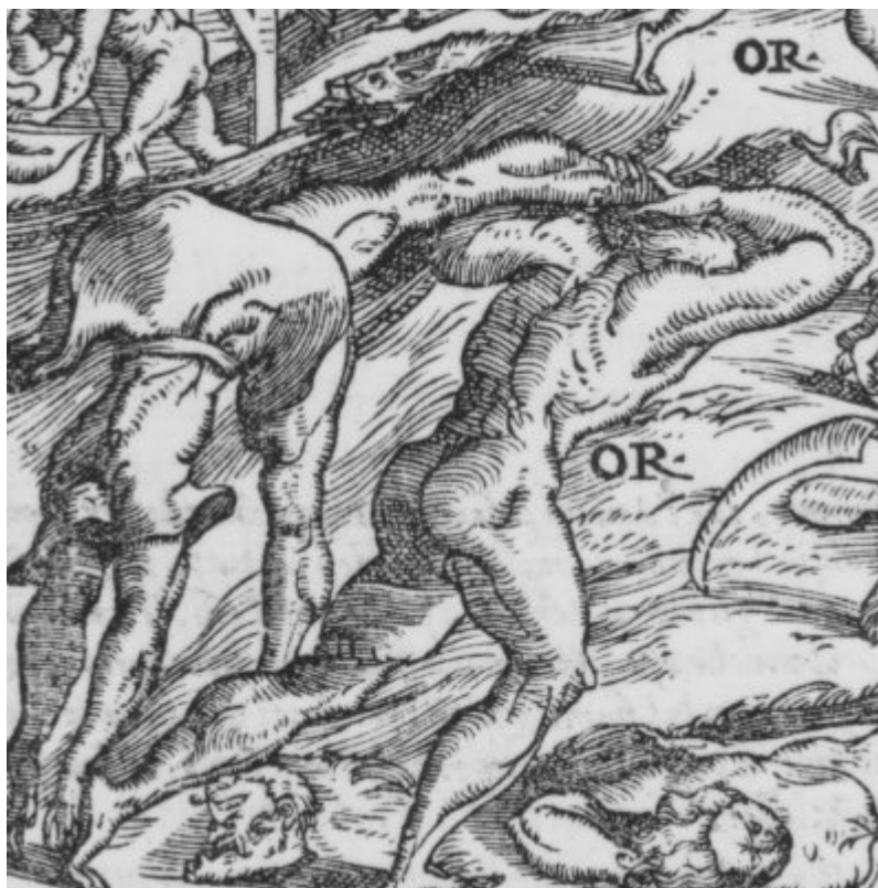
La folie de Roland ( Roland furieux , Valgrisi, 1560, chant 24)

Le même Roland à l'arrière-plan à gauche empoigne un berger, tandis que deux autres plus éloignés lèvent les bras au ciel et s'apprêtent à fuir. C'est là la représentation atténuée de la barbarie ultime de ce déchaînement de fureur : dans le texte, Roland décapite d'abord le berger, puis attrape son corps par une jambe et l'utilise pour frapper tout ce qui bouge autour, jusqu'à étendre à terre sa massue humaine (XXIV, 5-6). Ces différentes actions sont décomposées ici sur la toile : le corps sans tête à gauche, le berger empoigné derrière et le berger étendu mort, comme endormi devant au premier plan, sont peut-être après tout trois personnes différentes. L'Arioste, avec ce berger utilisé comme massue, reprend un motif de l' Hercule furieux , Hercule massacrant le berger Lichas avant de se jeter dans le bûcher sur l'Œta [34] . C'est bien ce Roland-Hercule furieux qu'avait représenté le graveur au premier plan de la gravure du chant XXIV pour l'édition Valgrisi de 1556 (ill. 12).