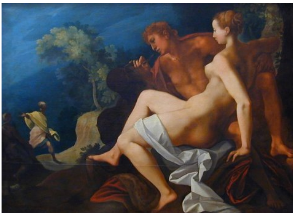
Angélique et Médor - Dubreuil

Le principe de composition des tableaux du cycle du château d'Effiat pourrait donc sembler, en première analyse, obéir à une logique de composition archaïque, voire dépassée. À moins que ces tableaux ne soient pas exactement... des tableaux ! Deux éléments sont en effet à prendre en compte : d'une part, ils illustrent un texte, le Roland furieux , et ils l'illustrent dans la logique d'un cycle de peintures, nécessairement narratif ; d'autre part, ils ont pu être conçus comme des cartons de tapisseries, dont les principes de composition évoluent plus lentement que ceux de la peinture de chevalet. Cette dernière n'a que rarement retenu, dans l'histoire d'Angélique et Médor, l'épisode du sauvetage. On peut citer plusieurs compositions de Giovanni Lanfranco, un tableau de Giovanni Francesco Romanelli : tous privilégient le couple formé par Médor allongé, blessé, et Angélique auprès de lui [5] , c'est-à-dire la séquence précédente, représentée en bas à gauche sur notre tableau. Mais la séquence plébiscitée est la suivante, celle des amours pastorales et du chiffre gravé.