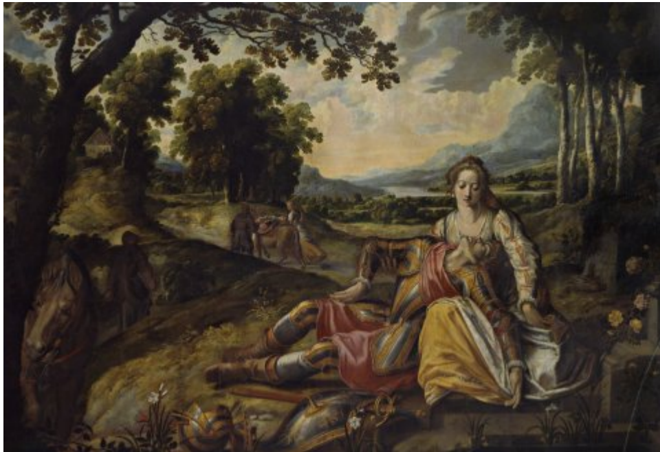
Un ermite au secours d'Isabelle pleurant la mort de Zerbin (Cycle d'Effiat)

Le dernier tableau, de La Mort de Zerbin , reprend une composition narrative symétrique de celle de l'Angélique et Médor . Au deuxième plan à droite, Zerbin renversé sur les genoux d'Isabelle expire près d'une fontaine, qu'on distingue dans le coin inférieur droit. À gauche, incapable de marcher plus loin, il a attaché son cheval à un arbre, qui se détourne pour ne pas voir son maître mourir. Devant Zerbin, constituant une nature morte au premier plan sous lui, son casque, son bouclier et son épée d'acier damasquiné d'or rappellent les armes posées à terre par Roland fourbu dans La Vision d'Angélique . Mais paradoxalement les armes de Zerbin, qui ne sont pas auréolées de la légende de celles de Roland, sont représentées ici avec beaucoup plus d'éclat. Le message est clair : Zerbin est le parfait chevalier, dont les armes gris et or reflètent la distinction brillante de sa parfaite courtoisie, et contrastent avec le noir brutal et le rouge sanglant de celles qui seraient pourtant les armes d'Hector, datant de la guerre de Troie (XXIV, 60).