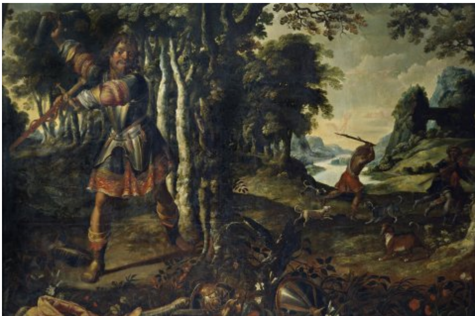
Roland au 4e jour arrache son armure (Cycle d'Effiat)

« Et fatigué à la fin, finalement trempé de sueur quand son haleine vaincue ne répond plus à son indignation, à sa haine profonde, à sa colère ardente, il tombe sur le pré et tourné vers le ciel il soupire [32] . »