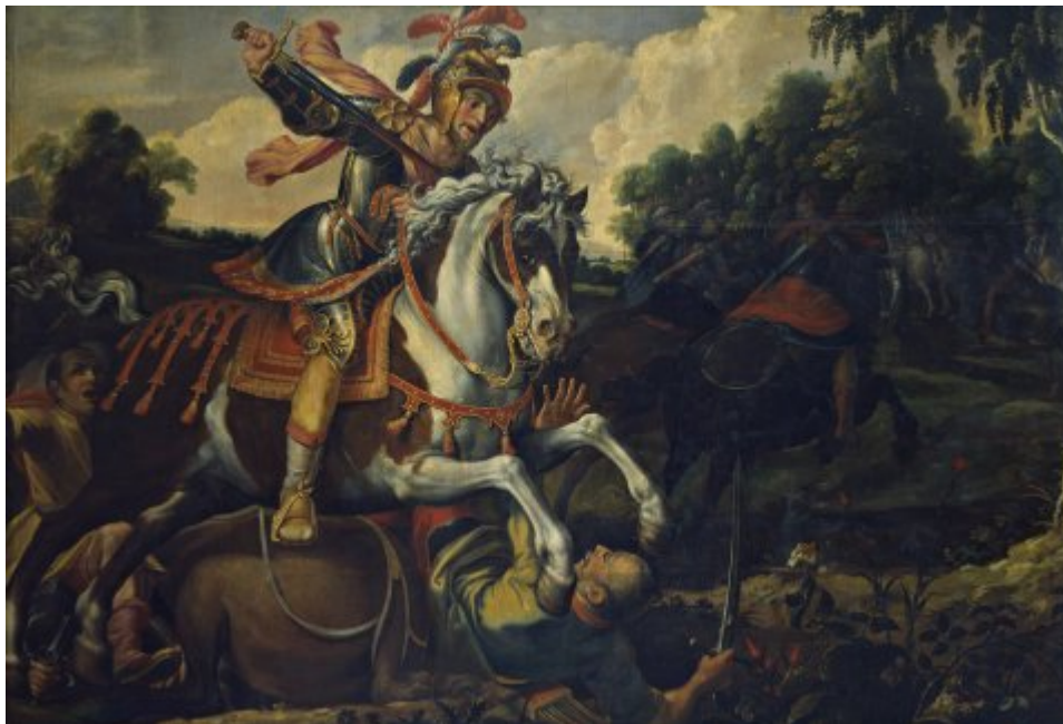
Roland renverse Manilard et met en fuite les alliés d'Agramant (Cycle d'Effiat)