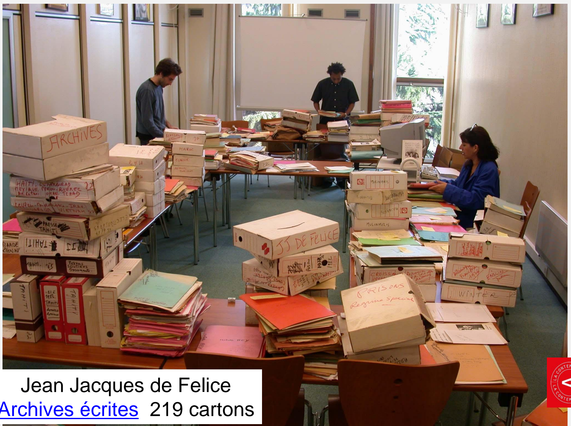
Jean Jacques de Felice Archives écrites 219 cartons