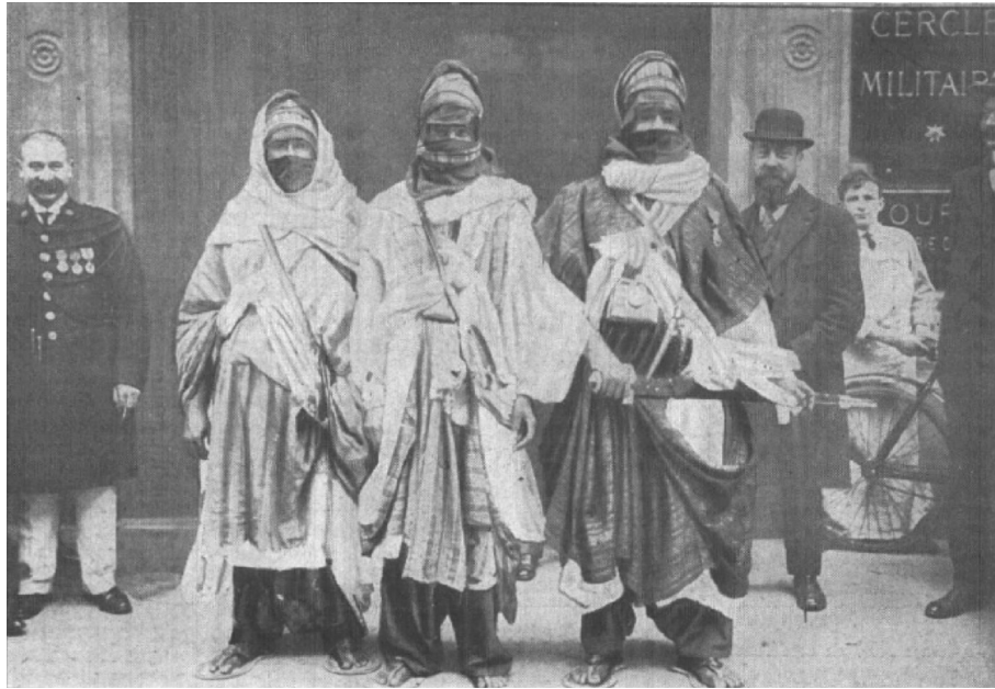
▲ Cette photo a été prise devant le Cercle militaire de Paris. Elle est parue en août 1910 et était simplement légendée: « Le caïd des Touareg et sa suite à Paris. »