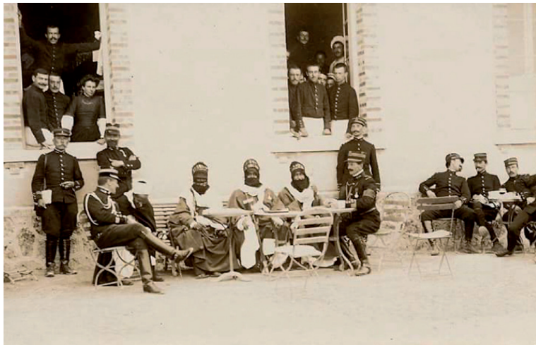
▲ La Mission Touareg reçue chez les militaires.