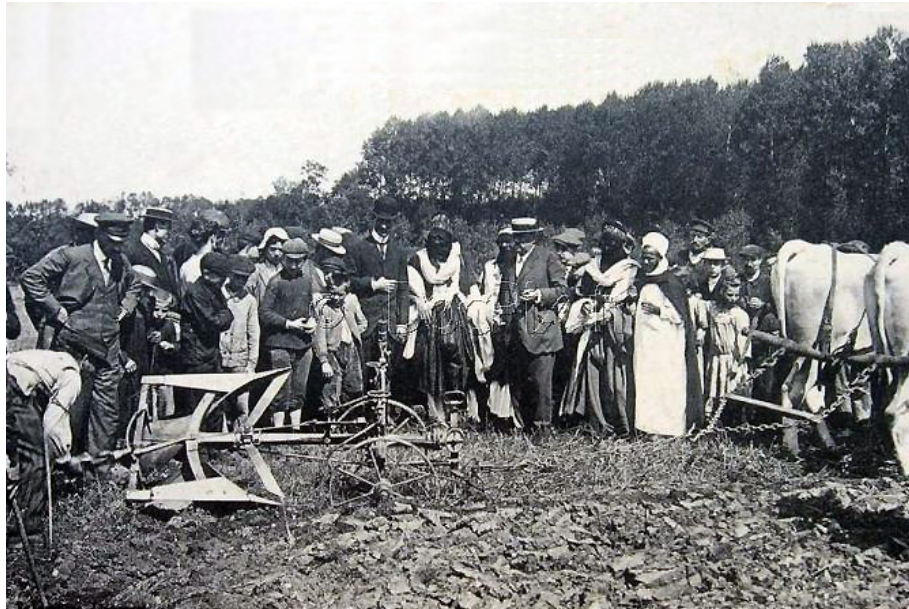
▲ À Liancourt, au nord de Paris dans l'Oise, la Mission Touareg visita une ferme et une usine de meulage.