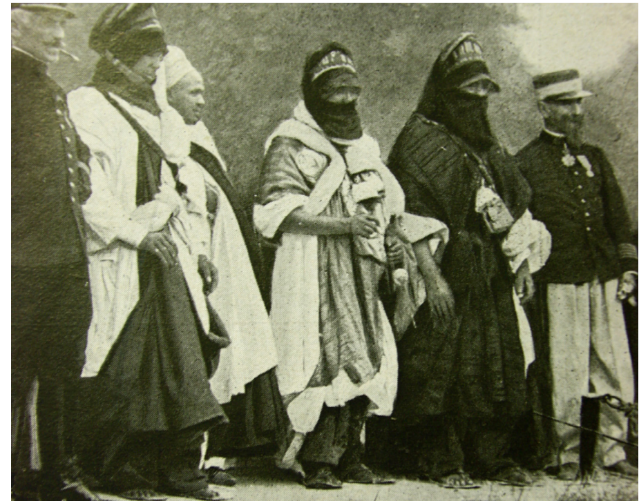
▲ La mission Touareg assiste à des manœuvres militaires sur les berges de la Marne. À l'extrême droite, le colonel Laperrine et à ses côtés Mûsa agg Amastan.