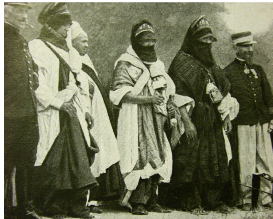
▲ La mission Touareg assiste à des manœuvres militaires sur les berges de la Marne. À l'extrême droite, le colonel Laperrine et à ses côtés Mûsa agg Amastan.

Loin de faire l'unanimité : pour mieux comprendre les dissensions qui pouvaient exister entre Laperrine et les autorités d'Alger et Paris, vous pouvez lire Une correspondance saharienne. Lettres inédites du général Laperrine au commandant Cauvet , paru chez Khartala en 2016.