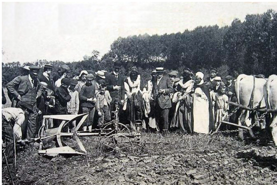
▲ À Liancourt, au nord de Paris dans l'Oise, la Mission Touareg visita une ferme et une usine de meulage.