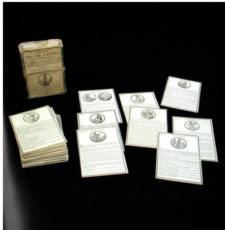
Figure 6. Photographie 1a. D'après La Grande Armoire , photographie 1a.

Il faut tourner la page, pour découvrir un agrandissement de cette page de titre, sur laquelle on ne parvient à déchiffrer le nom d'Addison que parce que nous savons, grâce au texte, qu'il s'y trouve :