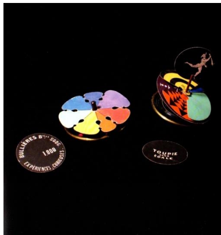
Figure 5. Photographie 7. D'après La Grande Armoire , photographie 7.

Le texte explique ici que la toupie multicolore, en tournant, produit une illusion d'optique et semble être de couleur blanche. La photographie ne peut certainement pas rendre cela, même si, par la rencontre du texte, le jeu de la toupie et l'illusion d'optique se trouvent suggérés.