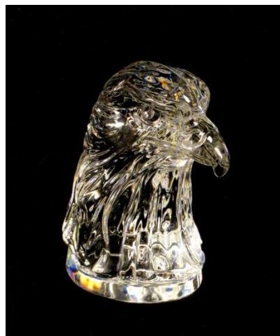
Figure 4. Photographie 80. D'après La Grande Armoire , photographie 80.

Michel Butor écrit le texte qui suit : « Cela vient sûrement d'un passage par Nancy. Mon frère Marc y avait habité, mais je pense qu'il n'y était plus. On m'a donc honoré de cette tête d'aigle en cristal de Baccarat. À quelle occasion ? Quand exactement ? Je n'en sais plus rien 11 » Les deux questions soulignent le fait que cet aigle ne permet d'évoquer aucune histoire et aucune époque. Ici, la photographie devient autonome : l'objet a peut-être été choisi parce qu'étant en cristal, il permet des effets de lumière intéressants à capter pour le photographe. La photographie met en évidence les lacunes du texte, qui ne sait rien dire de cet objet énigmatique.