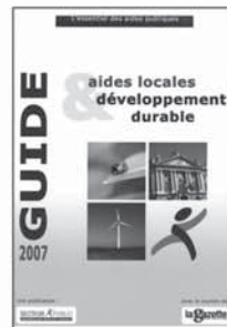
15 29,90 €