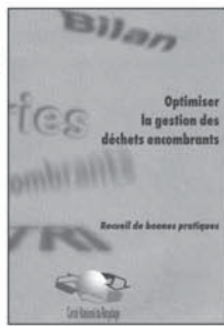
10 29 €