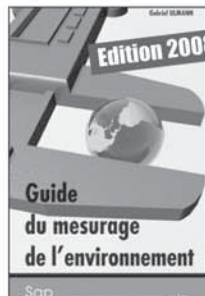
9 69 €