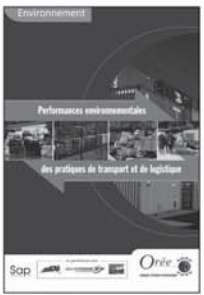
13 38,8 €