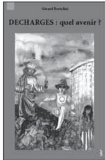
2 32,01 €