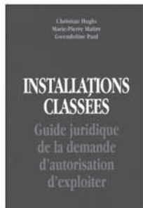
7 28 €