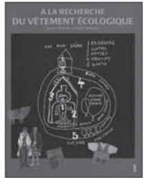
5 27,44 €