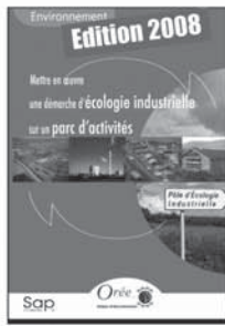
14 38,8 €