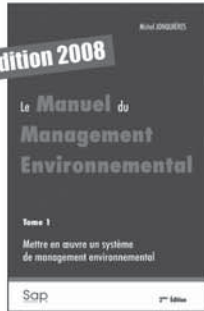
1a T.1 - 56 €