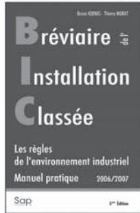
4 58 €