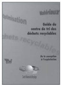
11 24 €