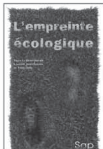
16 25 €