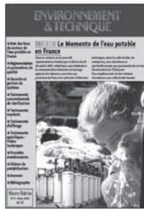
6 25 €