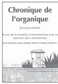
8 22 €