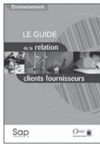
12 35,5 €