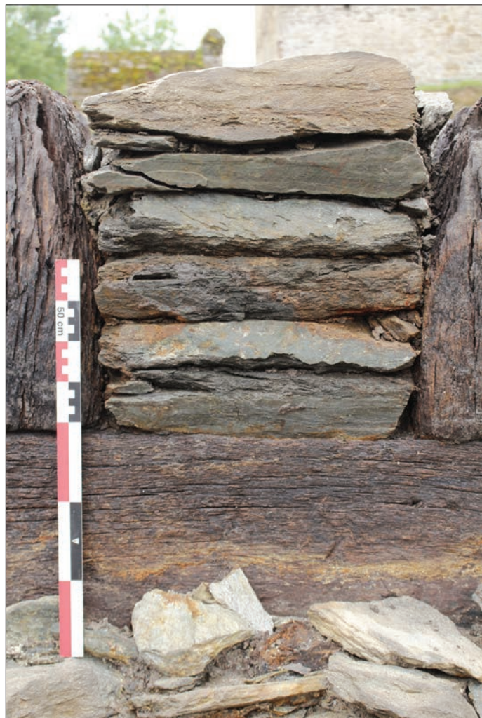
Fig. 8 – Détail d'un hourdis de la façade occidentale du caisson CA19.