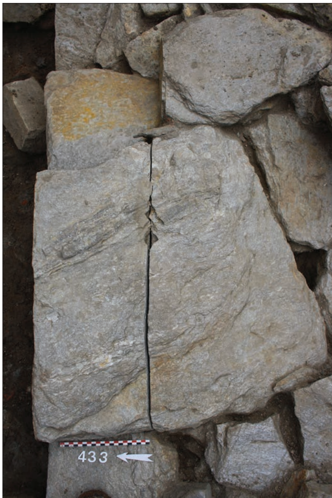
Fig. 6 – Dalle de parement en cours de sciage.

aussi bien être provoqué par la partie concave d'un marteau tête-pic que par une autre pierre utilisée comme percuteur. Cette proposition a été validée par expérimentation, en percutant une pierre contre l'arête d'une dalle de micaschiste. Les résultats obtenus correspondent parfaitement aux enlèvements identifiés, nuanciant ainsi les propos sur l'importance du travail imputable à la grande quantité de dalles de remplissage marquées par ce type d'impact.