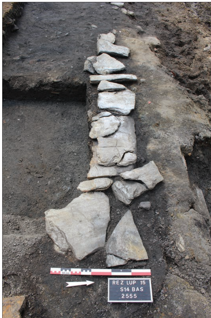
Fig. 7 – Détail d'un solin (cliché : T. Maisonneuve).

Des témoignages d'une action de sciage sur certaines dalles ont été identifiés. Le micaschiste étant de nature très tendre, sa découpe s'avère relativement facile avec une scie à dents (Bessac 2004, p. 23). Sur l'ensemble du site, trois exemples de dalles en cours de sciage ont été observés (fig. 6). Les saignées, restées inachevées, font environ 2 cm de largeur et se poursuivent sur la moitié, voire presque la totalité de la longueur de la dalle. Sur l'une d'elles, la présence d'un filon de quartz au sein même de la structure minéralogique, a contraint le tailleur à abandonner la découpe, même s'il a tenté d'attaquer les deux côtés. Face à la dureté du quartz, la scie est inefficace, mais la dalle a tout de même été utilisée dans l'aménagement.