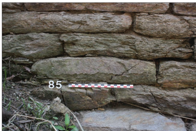
Fig. 4 – Dalle de parement avec stigmates de dégauchissage.