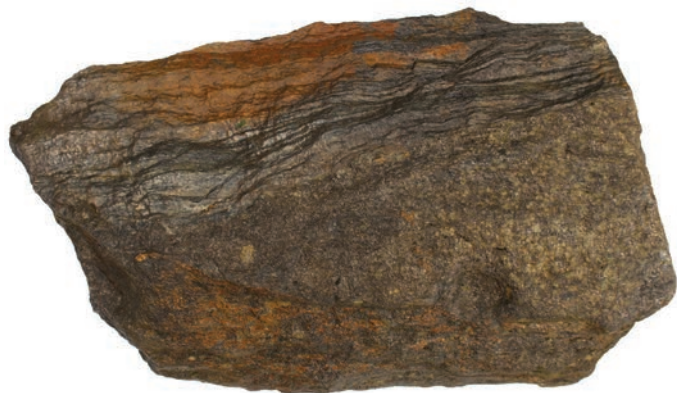
Fig. 3 – Dalle présentant une possible marque de coin.