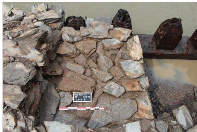
Fig. 9 – Détail du chaînage du remplissage avec les hourdis.

Le parement est soigneusement érigé sous la forme de hourdis insérés entre deux poteaux en bois ; ils sont rigoureusement assisés et les dalles y sont empilées les unes sur les autres. L'irrégularité des produits, liée à la nature de la roche, est résolue