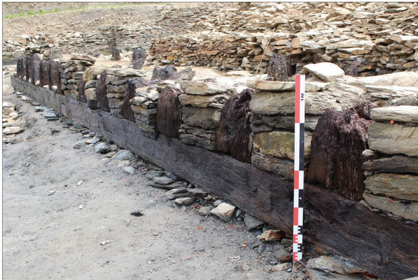
Fig. 1 – Vue de la façade septentrionale du caisson CAI9 alternant bois et pierre.