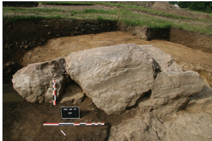
Fig. 2 – Détail d'une des carrières retrouvées sur le site.

Durant l'époque romaine, l'emploi des ressources locales au sein des grands chantiers monumentaux est courant, car elles sont moins coûteuses et accessibles rapidement (Seigne 2004, p. 58). Les carrières étaient donc localisées à leur proximité, procurant ainsi un gain de temps considérable. À Rezé, de