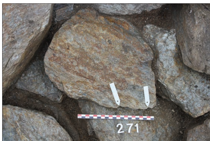
Fig. 5 – Exemple d'enlèvements présents sur les éléments de remplissage.

par l'enlèvement d'un bloc ou encore des traces d'arrachements générés par des coins ou des pics utilisés dans les diaclases (Polinski, Pirault 2013 ; Polinski 2019, p. 45-46). Des dalles découvertes au sein même du remplissage des caissons présentent des marques issues de ces deux procédés. Bien que l'usage du pic d'extraction semble plus courant, l'emploi de coins