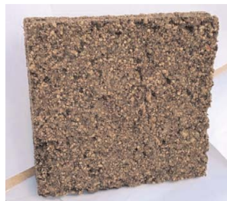
Fig. 3 : Eprouvettes de grignon/cellulose