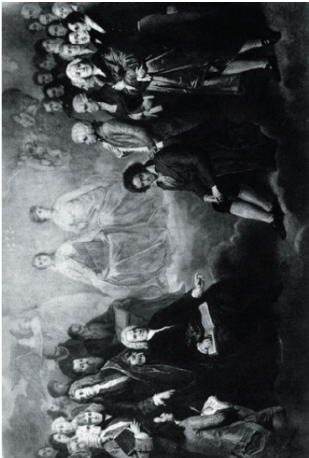
Édouard HAMMAN, Le Parnasse musical , s.d. lithographie de Amédée et Jean Varin (collection privée)