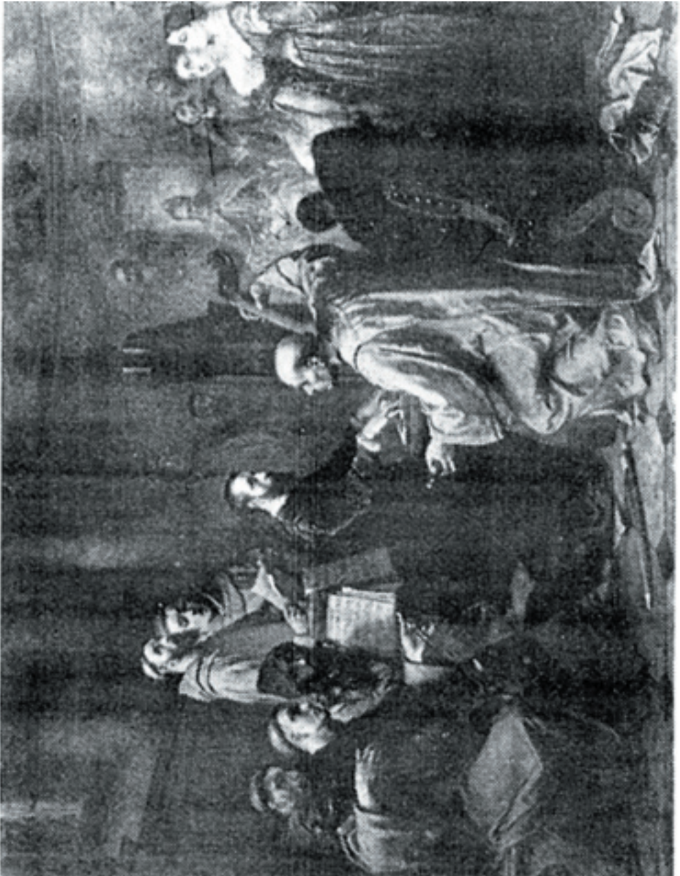
Édouard HAMMAN, La Messe d'Adrian Willaert , 1854 huile sur toile, 145 x 207,5 (Bruxelles, Musée royal des Beaux-Arts de Belgique).