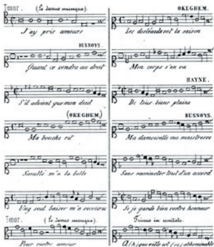
TABLE THÉMATIQUE des pièces contenues dans le Manuscrit 295 de la Bibliothèque de Dijon.

Stephen MORELOT, De la musique au XIX e siècle.