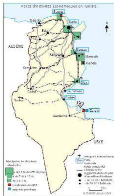
Fig. 2:

Au-delà de ces éléments de contextualisation, cette première étape de la recherche nous invite à définir, sur des bases communes, les concepts clés du programme et en premier lieu celui d'entrepreneur. L'entrepreneur est d'abord un créateur d'entreprise, qu'il soit contraint de créer son emploi ou qu'il incarne la figure de l'entrepreneur schumpétérien, innovateur et élément moteur de la transformation sociale. Mais au-delà, c'est aussi celui qui monte une affaire, sans en être nécessairement le propriétaire ; la tête de pont d'une entreprise qui se déploie au loin. Un manager, chef d'établissement, peut donc endosser l'habit de l'entrepreneur. La troisième acception est celle du leader, du « civic entrepreneur » qui va œuvrer dans le champ organisationnel ou associatif, patronal ou syndical ... Le terme de « civic entrepreneur » combine alors deux aspects dans la tradition américaine: l'entrepreneurship (esprit d'entreprise) et la vertu civique ou sociale (esprit de communauté). La dimension transméditerranéenne revêt à son tour plusieurs champs d'application. Tout d'abord, le mouvement à travers l'espace : est