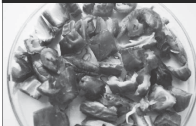
Figure 1 : Aspect des dattes et leurs noyaux après séchage

Les sous-produits de dattes de masse initiale = 100 g sont coupés en petits morceaux et sont placés avec leurs noyaux dans des coupelles préalablement tarés et ensuite sont mis dans une étuve réglée à la température désirée. La masse de l'échantillon est mesurée chaque 2 heures. Au bout de quelques jours, la masse de l'échantillon ne varie plus et l'équilibre s'établit, l'expérience de la mesure de la perte de poids est arrêtée. La figure 1 illustre l'aspect du produit après séchage.