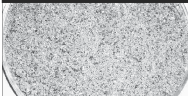
Figure 2 : Aspect de la poudre de datte

Après séchage, l'ensemble noyau et pulpe est broyé par un broyeur ultracentrifuge ZM 200. La poudre obtenue est tamisée et conditionnée pour les analyses. La figure 2 illustre l'aspect de la poudre obtenue après broyage.